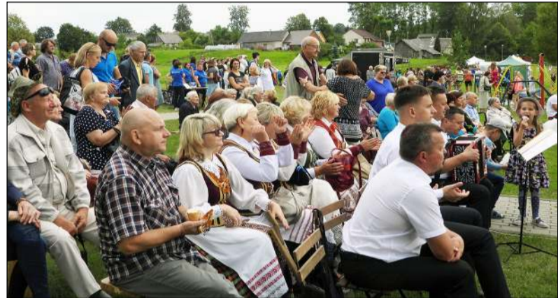
Balninkuose rengiamos šventės visuomet sulaukia didelio bendruomenės narių dėmesio

tro „Meniškas kaimas“ gavo finansavimą dviem projektams – „Kvapų terapija gerai savijautai“ (640 Eur) ir bendruomenės namų elektros sąnaudų išlaidų padengimui (500 Eur). Girsteitiški bendruomenės centro projektui „Akcija „Kartu dirbam, kartu džiaugiamės“ skirtas 330 Eur finansavimas, Alantos dvaro bendruomenės projektams – tapybos plenerui „Molėtų krašto motyvai“ – 600 Eur ir Alantos dvaro bendruomenės pastato išlaikymo išlaidoms – 500 Eur, Molėtų rajono literatū bro-