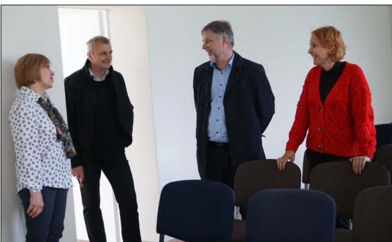
Rajono vadovas lankėsi ir atnaujintose progimnazijos patalpose, kurios nuo šiol – Menų mokykla

Dar vienas aktualus ir keletą metų aptarinėtas bei įvairiausių sprendimų sulaukęs projektas – Menų mokyklos patalpų paieška – remontas. Priminsime, jog Menų mokykla, įsikūrusi vaikų lopšelyje darželyje „Vyturėlis“, neturėjo tinkamų sąlygų darbui ir vaikų ugdymui, o ir ikimokyklinio ugdymo įstaiga visus tuos daugelį metų jautėsi suspaušta. Iš pradžių planuota Menų mokyklai pritaikyti atsilaisvinusį vaikų globos namų pastatą, bet padarius preliminarų projektą, suprasta, jog tai – ne savivaldybės biudžeto ištekliams. Kelių aukštų pastato pritaikymas Menų mokyklai pernelyg