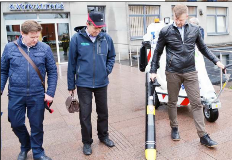
Susidomėjimo nauja ir modernia komunaline technika būta nemenko

plektacijos - siurblio kaina prasideda nuo 15 tūkst. eurų, o automobilio – nuo 20 tūkst. eurų. Kol susidomėjusieji suko ratus savivaldybės aikštėje automobiliu, buvo demonstruojamas siurblio darbas, kuriuo šiukšles siurbti galima ne tik iš šiukšliadėžių, nuo trinkelėlių, bet ir nuo vejų ar akmeniukais grįstų viešųjų erdvių. Su įdomumu elektrinę techniką išbandė ir komunalinių įmonių iš Ukmergės ir Utenos vadovai, į automobiliuką sėdo ir jo funkcionalumą pajuto UAB „Molėtų švara“ padalinio vadovai, direk-