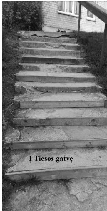
Į Tiesos gatvę

Idėjų traukos objektams - yra, bet pirmiausia reikia pasirūpinti gyventojų gerove. O atsistojus ant šių laiptų galima gėrėtis ir sutvarkyta M. Apeikytės gatve, Pavasarininkų kalnu ir žiūrėti dar ne taip seniai buvusius baisius, o dabar gražiai sutvarkytus laiptus į vieną aukščiausių vietų mieste.