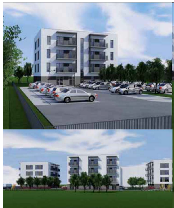
Projektuotojai svarstymui pateikia tokią vizualizaciją, bet iki realių žingsnių neprieita, nes sutartis su laimėtoju, pastarajam neatvykus, ne-

Prabėgo keliasdešimt metų nuo paskutinio mūsų mieste daugiabučio namo statybos. Tai, kad gyvenamojo būsto stinga, matyt, jau žinoma visiems, tai nuolat akcentuoja ir gyventojai, ir rajono savivaldybė bei taryba. Tačiau iki šiol privatiems statytojams intereso investuoti mūsų krašte būtent į daugiabučių statybą nebūta. Tik rajono savivaldybei suskatus ieškoti sklypų ir juos parengti minėtoms statyboms, skelbtas konkursas statytojams. Įdomu tai, kad jau pirmajame konkurse atsirado dalyvaujan-