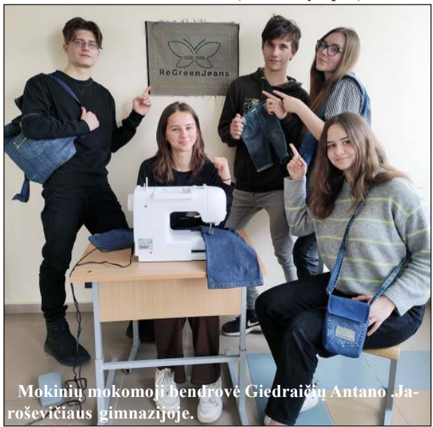
Mokinių mokytojų bendrovė Giedraičių Antano Jaroševičiaus gimnazijoje.

„tvarumo vežimą“ įtraukė ir jau minėtas gimnazijas – partneres. Tačiau šiuokart apie Giedraičius ir jų kūrybišką gimnazijos kolektyvą. O prasidėjo viskas nuo to, kad verslumo skatinimui gimnazijoje buvo įkurta Mokinių mokytojų bendrovė pagal praktinio verslumo projektą.