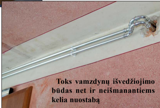
Toks vamzdinių išvedžiojimo būdas net ir neišmanantiems kelia nuostabą

si, kad prašant pateikti protokolus, kuriuose tai būtų užfiksuota, teko išgirsti, kad juos atsakingam bendrovės specialistui nešiotis sunku... Kitaip sakant, protokolai, kur būtų užfiksuota, kad gyventojai atsisako šalto vandens stovų keitimo, taip ir nebuvo pateikti, nors pernai gegužę vykusiam susirinkime buvo sutarta, jog stovai bus keičiami. Beje, kuomet vis tik buvo pateiktas susirinkimo protokolai, jame buvo