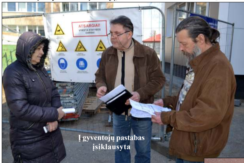
Į gyventojų pastabas įsiklausyta