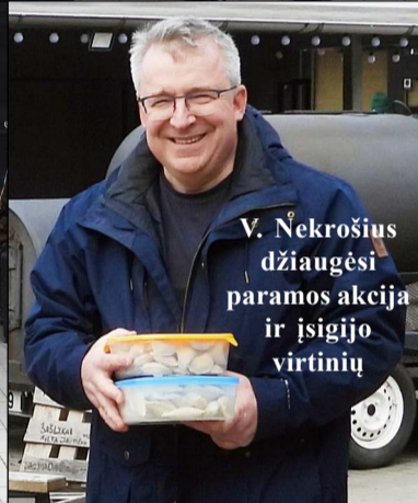
V. Nekrošius džiaugėsi paramos akcija ir įsigijo virtinių