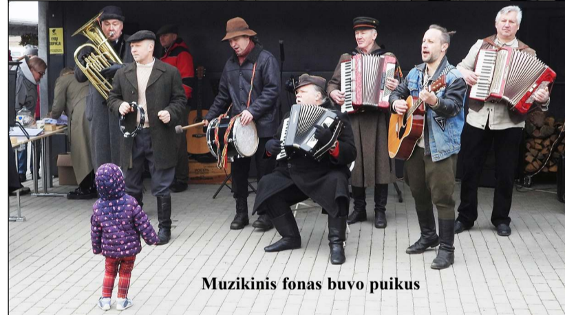
Muzikinis fonas buvo puikus