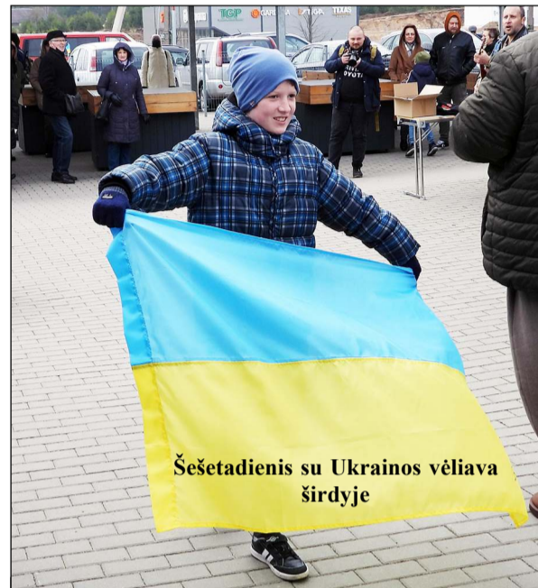
Šešetadienis su Ukrainos vėliava širdyje