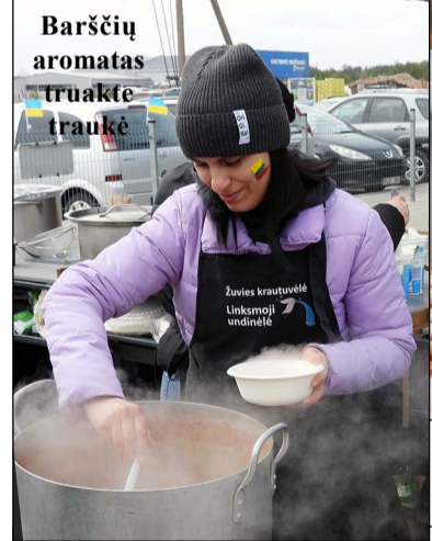
Barščių aromatas truakė traukė