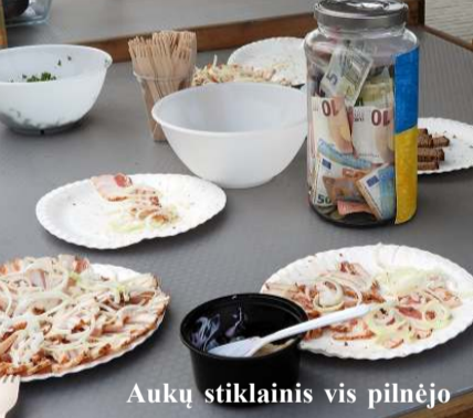
Aukų stiklainis vis pilnėjo