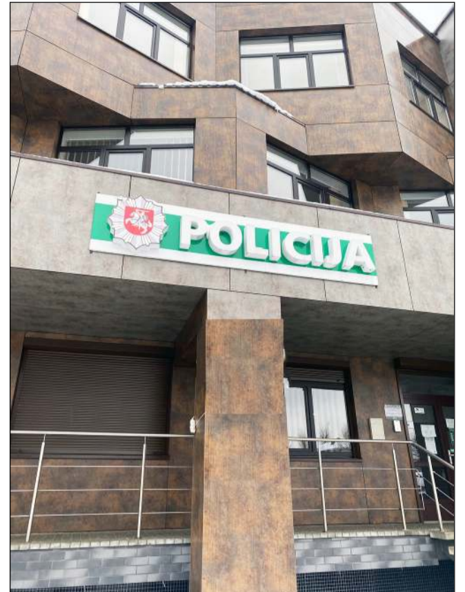
Pagal turimą 11 metų statistiką pernai metais gauta daugiausia pranešimų - 5247