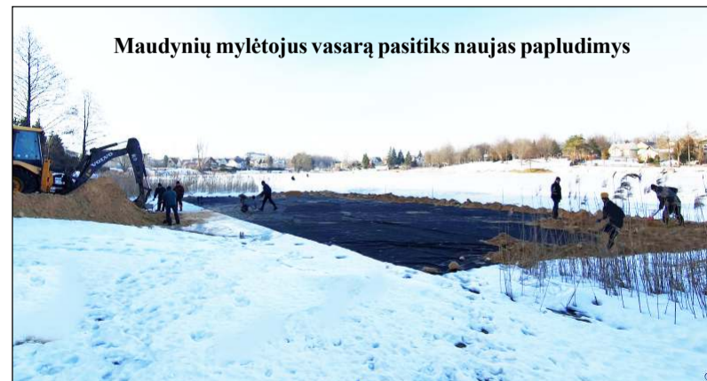
Maudynių mylėtojus vasarą pasitiks naujas papludimys

jama maudykla. Beje, ji šioje vietoje, tiksliau – kitoje ežero, kur įsikūrusi pagrindinė miesto maudykla, pusė-