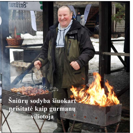
Šniūrų sodyba šiuokart prisitatė kaip gurmanų viliojoja