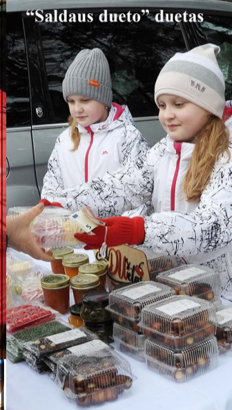
„Saldaus dueto“ duetas