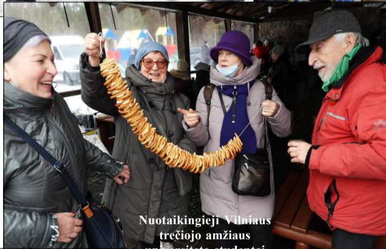
Nuotaikingieji Vilniaus trečiojo amžiaus universiteto studentai