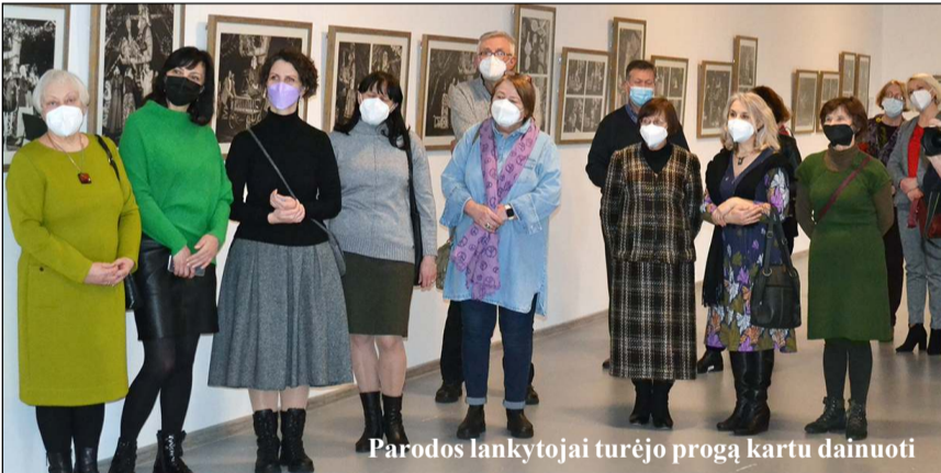
Parodos lankytojai turėjo progą kartu dainuoti