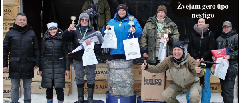
Žvejams gero ūpo nestigo