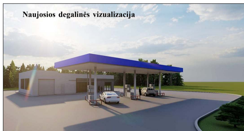
Naujosios degalinės vizualizacija