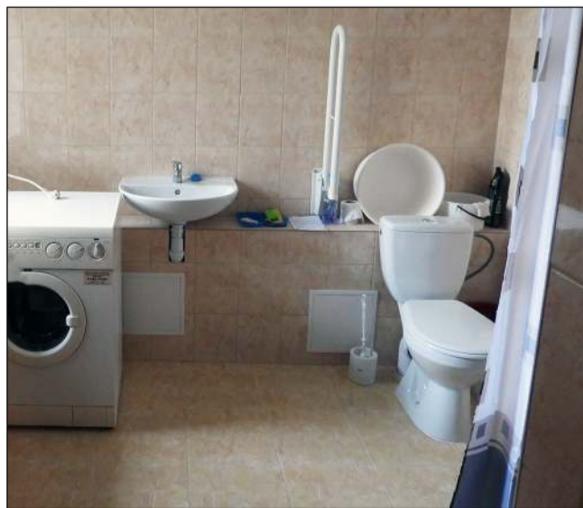
Neįgaliesiems dažniausiai pritaikoma dušo, tualetų patalpa