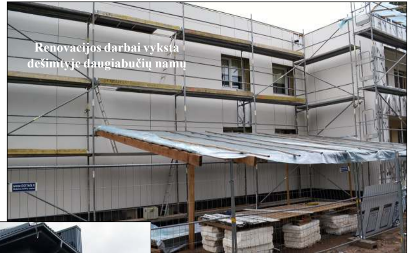
Renovacijos darbai vyksta dešimtyje daugiabučių namų

-Realybė tokia, kad pirkimus skelbdavome ir tris, ir keturis kartus.