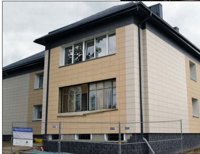
Šiemet renovacijos procese ketina dalyvauti aštuonių daugiabučių namų gyventojai

namus gyventojų prašymų padaugėjo. „Paraiškas dėl renovacijos reikėjo pateikti iki gruodžio 31 dienos, o buvo prašymų, gautų iki šio termino pabaigos likus ir dviem, ir trimis savaitėmis. Per tokį trumpą laiką parengti investicinį daugiabučio namo renovacijos projektą, surengti mažiausiai tris gyventojų susirinkimus laiko per mažai. Kiek suspėjome, tiek paraiškų ir pateikėme. Šiemet renovacijos procese ketina dalyvauti aštuonių daugiabučių namų gyventojai. Pateikėme vertinimui Inturkės g. 35 ir 37, J. Janonio 8, 18, 20, 30, Vilniaus g. 52 numeriais pažymėtų daugiabučių namų Molėtuose ir Šilo g. 3, Giedraičiuose paraiškas, - kalbėjo UAB „Molėtų švara“ projektų vadovas, pridūręs, kad iš viso prašymai buvo gauti net iš 14 – os daugiabučių namų gyventojų. Vieniems prašymams buvo li-