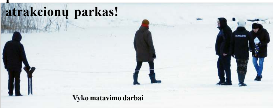
Vyko matavimo darbai