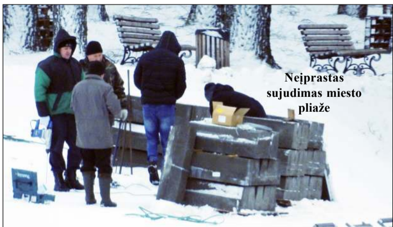
Neįprastas sujudimas miesto plažėje

Nors už lango – viduržiemis ir vasariškos pramogos dar neaktualios, bet prasidėję darbai ant Pastovio