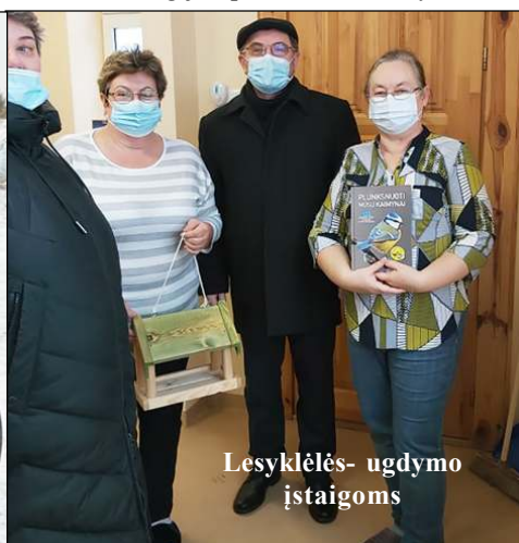
Lesyklėlės- ugdymo įstaigoms