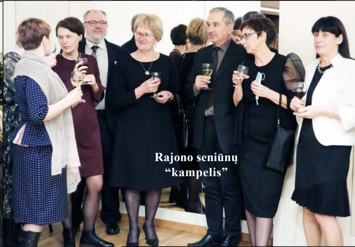
Rajono seniūnų „kampelis“