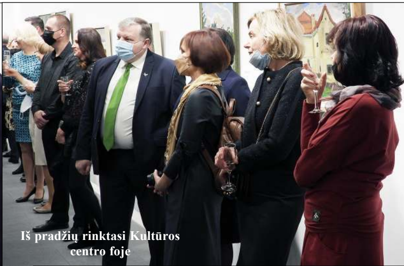
Iš pradžių rinktasi Kultūros centro foje