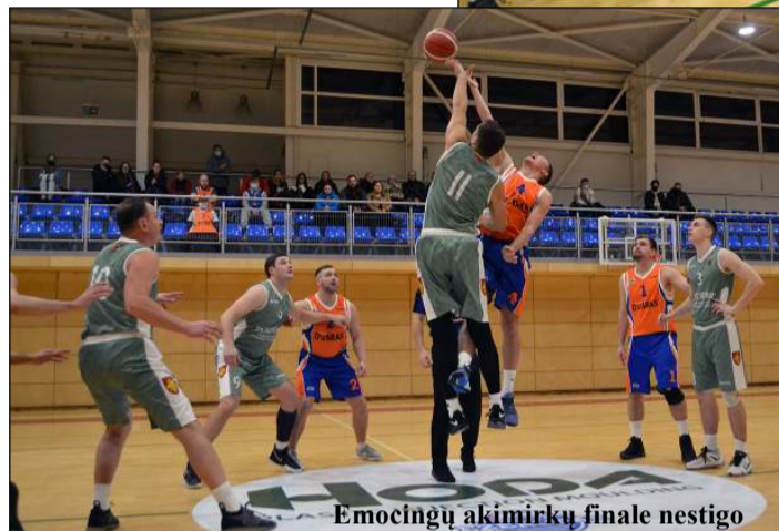
Emocingų akimirku finale nestigo