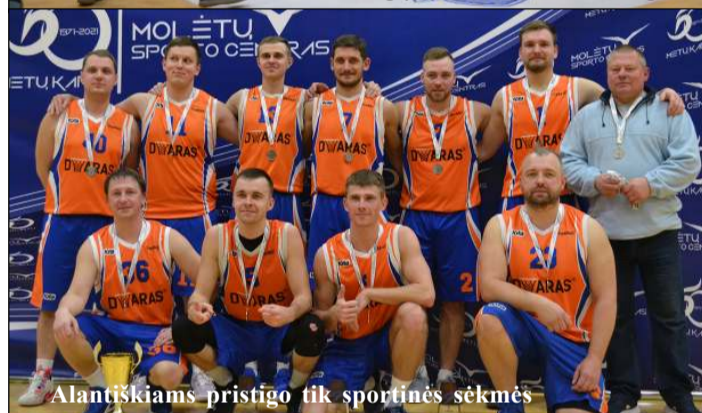
Atlantiškiams pristigo tik sportinės sėkmės