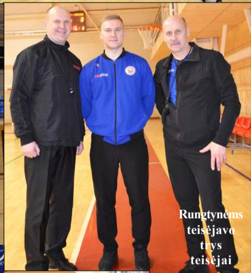
Rungtynėms teisėjavo trys teisėjai