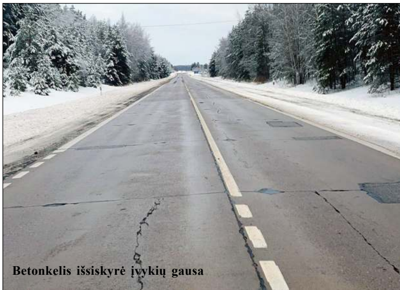
Betonkelis išsiskyrė įvykių gausa

Daugiau negu pusšimtį pranešimų policijos pareigūnams gavus per praėjusią savaitę, dar 45 kartus vykta tikrinti koronavirusu sergančių ir saviizoliacijoje esančių asmenų. Itin daug pranešimų gauta dėl eismo įvykių. Šešis iš jų sukėlė laukiniai gyvūnai – į kelio važiuojamą dalį išbėgusios stirnos. Trys tokio pobūdžio eismo įvykiai registruoti magistraliniame kelyje. Dar 11 eismo įvykių registruota dėl slidžios kelio dangos ir neprižiūrimo betonkelio, kurio yrantį dangą jau kelia pavojų. Šeštadienį vienas po kito skubios pagalbos tarnybos telefonu skambinę vairuotojai pranešė apie atsivėrusią duobę maždaug 69 kilometre, ties Juodėnų kaimu. „Volvo“ vairuotojas šioje vietoje prakirto automobilio