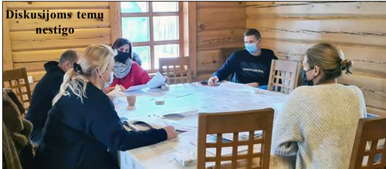
Diskusijoms temų nestigo

Molėtų krašto verslininkų asociacija įpusėjus Europos sąjungos lėšomis finansuojamam projektui „Pagalbos verslo pradžia teikimas Molėtuose“