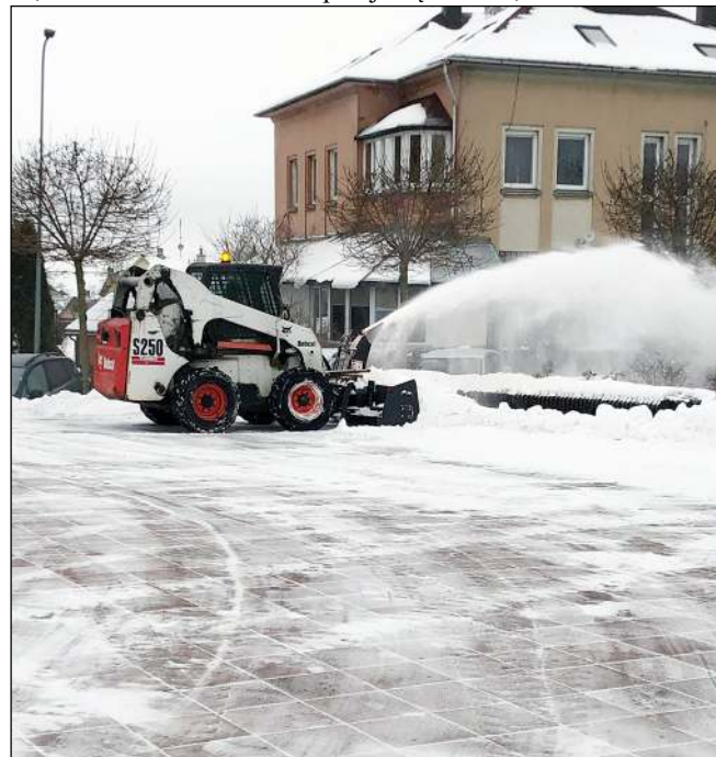
Viena iš erdvių kurioje gali dirbti mechanizmai – Jaunimo aikštė