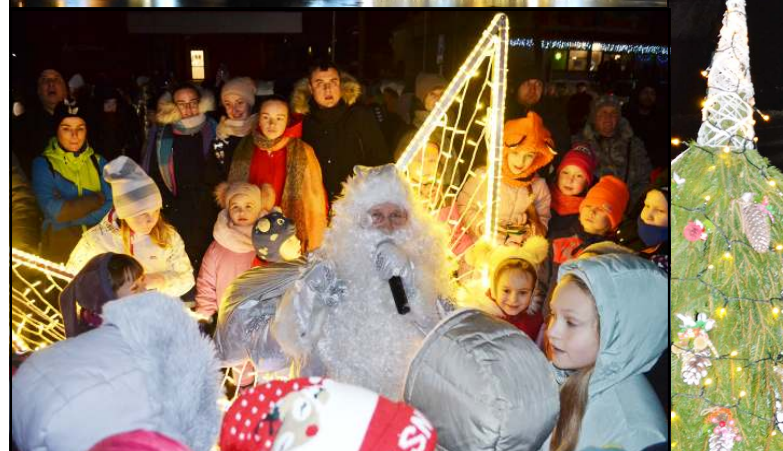
Su Kalėdų seneliu mažieji molėtiškiai fotografavosi ir sveikinosi ant interaktyvaus suoliuko

Molėtuose proga vaikai buvo kviečiami žiūrėti animacinį filmą „Mažosios Klaros kalėdos“, o vyresnieji į naktišokius Atvirame jaunimo centre su grupe „Skandalistai“. Tiesa, negalintieji dalyvauti švenčių laukimo pradžios atidaryme, renginį