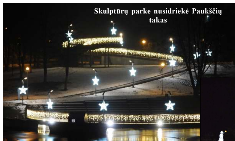
Skulptūrų parke nusidriekė Paukščių takas