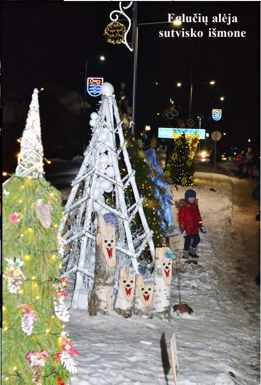
Eglučių alėja sutvarko išmone

Dangiškos Kalėdos apgaubė Molėtus įžibus interaktyvią eglę savivaldybės aikštėje, šalia kurios įrengtas „stebuklingas“ suolelis, ant kurio atsėdus eglė suspindi vis kitomis spalvomis. Tuo tarpu mažieji šventės dalyviai, ypatingai pasiilgę gyvo bendravimo su Kalėdų seneliu, net į eilę rikiavosi norėdami nusifotografuoti, pasėdėti ant suolelio. Smagu, kad šiemet eglės įžiebimo šventė nesibaigė tik pabuvimu aikštėje. Dangiškų Kalėdų