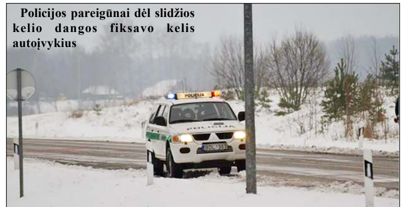
Policijos pareigūnai dėl slidžios kelio dangos fiksuoja kelis autoįvykius

įspūdingi skaičiai – 5, 53 prom.! Visokių meilės apraiškų savo darbo praktikoje matę policijos pareigūnai su viena iš įdomesnių susidūrė praejusią savaitę. Sunerimusi dėl su-