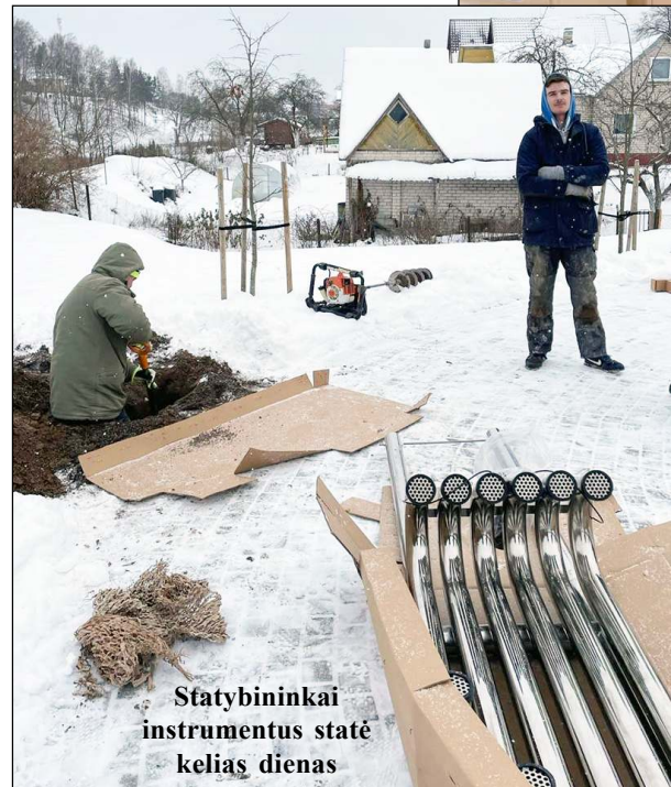
Statybininkai instrumentus statė kelias dienas

kiški muzikos instrumentai, kurių gamintojas Percussion Play. Muzikos instrumentai yra gaminami iš aukščiausios kokybės medžiagų, rankiniu būdu preciziškai suderinami, o tai pavyksta tik dėka ilgametės patirties ir idealios muzikos meistrų klausos dirbtuvėse Hampšyre, Di-