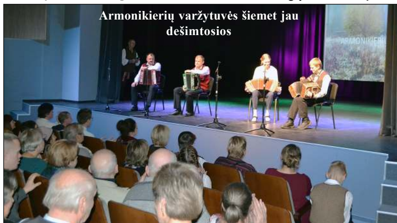
Armonikierių varžytuvės šiemet jau dešimtosios