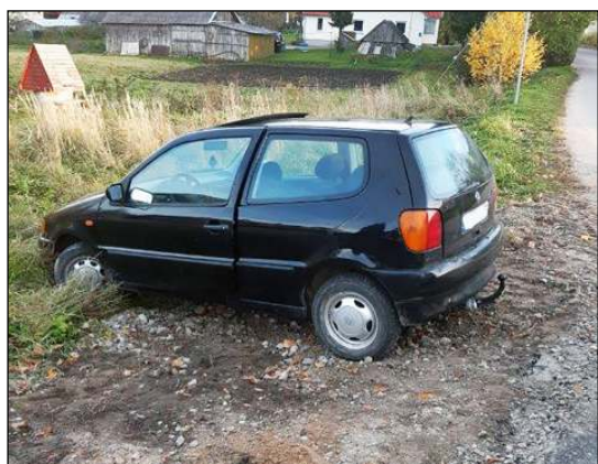
Neblaivaus molėtiškio kelionė baigėsi Darbo gatvėje

kiniai gyvūnai - betonkelyje „Opel“ vairuotojas neišvengė susidūrimo su briedžiu, dar du eismo įvykius sukėlė stirmos. Skubios pagalbos telefonu buvo pranešta apie įvykį Vidieniškų s., kur ant kelio važiuojamosios dalies nuvirto medis, nutraukęs elektros laidus. Pagalbą suteikė ugniagesiai gelbėtojai bei buvo informuota ESO. Iš Jonišio seniūnijos gautas pranešimas apie šalia kelio esantį iškastą