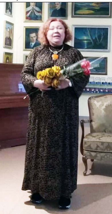
Charizmatiškoji Violeta pakėri savo nuoširdumu

tuvė, kurioje eksponuojama prieš 15 metų doc. Kazio Strazdo surinkta