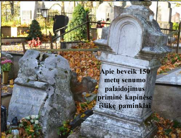
Apie beveik 150 metų senumo palaidojimus priminė kapinėse išlikę paminklai