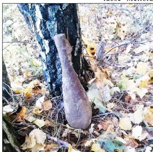
Miną be sprogstamosios medžiagos išvežė iš-minuotojai

pareigūnams, kurie vyrui nustatė 1,64 prom. girtumą, sakė, kad piktumai kilo dėl vakar dienos ir sugyventinio išgerto alaus. Dubingių seniūnijoje sekmadienio dieną pareigūnai sulaukė 41 metų vietos gyventoją, kuris neturėdamas teisės vairuoti vairavo mopedą be valstybinių numerių ir dar buvo neblaivus. Vyrui nustatytas 3,21 prom. girtumas. Iš Dubingių s. skubėta į Molėtus gavus pranešimą, kad vaikų darželio teritorijoje Liepų gatvėje girtaujama. Trims vyrams, lėbavusiems vaikų darželio teritorijoje, surašyti protokoliai. Per savaitgalį dėl triukšmo policijos pareigūnai gavo ketu-