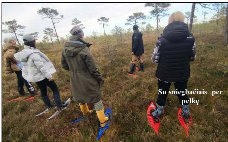
Su sniegbačiais per pelkę