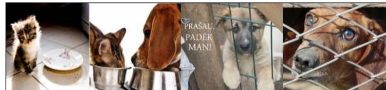
PRAŠAU, PADĖK MAN!