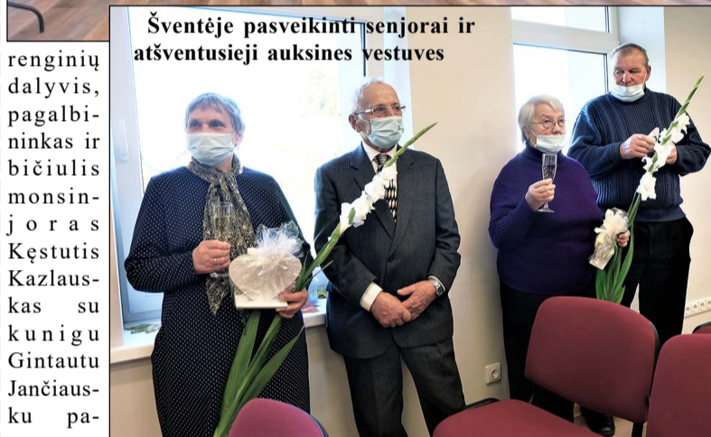
Šventėje pasveikinti senjorai ir atšventusieji auksines vestuves

rie pasveikinti pagyvenusių žmonių dienos proga. Kiek patirta šiltų, tikrų emocijų, akimirku, o ne vienam ir