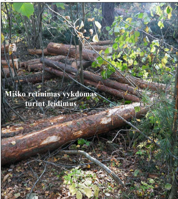
Miško retinimas vykdomas turint leidimus

Sodų bendrijos „Siesartis“ sodininkai prieš daugiau nei savaitę nustebo pamatę, jog beveik ant ribos su sodų bendrija „Berzelis“ esantis miškelis pradėjo retėti. Čia išpjauta daugybė išlakų ir, kaip mano neprofesionalai, dar perspektyvių pušų, kurios ilgus metus dar galėjo teikti pavėsį ir leisti gražia žaluma mėgautis akims. Tuo tarpu, kai sodininkai dažnai net kiekvieną kokį statybinį krus-