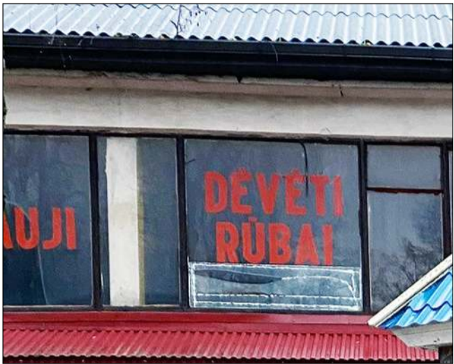
Reklama turi būti derinama su savivaldybe ne tik dėl diznio, bet ir estetinės išvaizdos, kad miestas nebūtų dalkomas beskonybe ir kiču

lėjome, nes vis tik verslui buvo labai nelengvas laikas. Atlaisvinus karantino suvaržymus, vėlgi pusmetį leidome susitvarkyti leidimus išorės reklamai, todėl viliamės, kad verslininkai dabar pasirūpins j