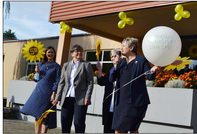
Projektinės lėšos gali būti panaudojamos ir mokytojų kvalifikacijai tobulinti

loms skiriamos kokybės krepšelio lėšos apskaičiuojamos pagal mokinių skaičių (127 eurų mokiniui per metus). 85 proc. sumos skiriama iš projekto, o likusieji 15 proc. - savivaldybės dalis iš rajono biudžeto. Tokių priemonių įgyvendinimu siekiama stiprinti savivaldybių, kurios gali ne tik teikti paraišką dėl mokyklų dalyvavimo projekte, bet ir pasirinkti sau aktualius švietimo kokybės gerinimo stebėsenos rodiklius, atsakomybę už ugdymo kokybės gerinimą.