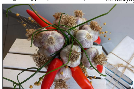
Visus sužavėjusios valgomos puokštės su gigan-tiškais česnakais