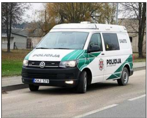
Savaitgalyje policijos pareigūnai sulaukė tris neblaivius automobilių vairuotojus