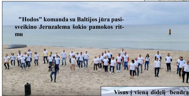
"Hodos" komanda su Baltijos jūra pasiseikino Jeruzalema šokio pamokos ritmu