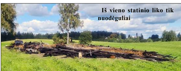
Iš vieno statinio liko tik nuodėguliai