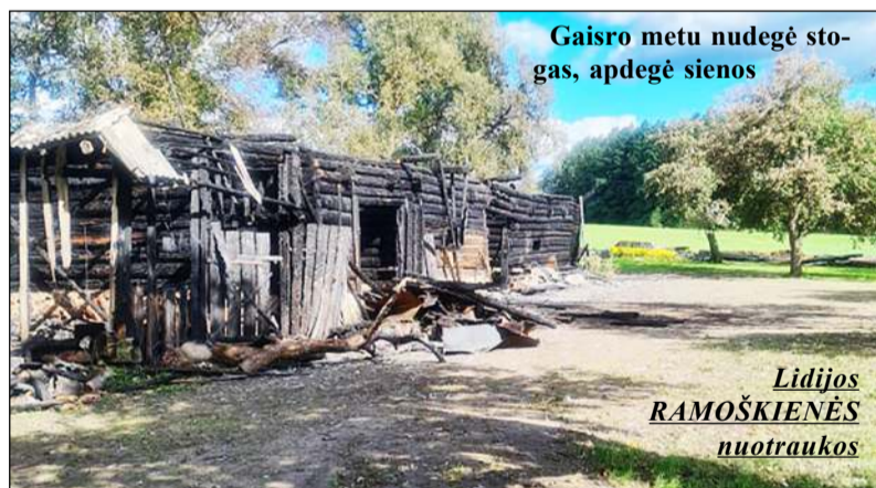
Gaisro metu nudegė stogas, apdegė sienos

klausančios vilniečių, du ūkiniai pastatai. Nuolat negyvenamoje sodyboje gaisrą - liepsnas pastebėjo bei (Nukelta į 3 psl.)