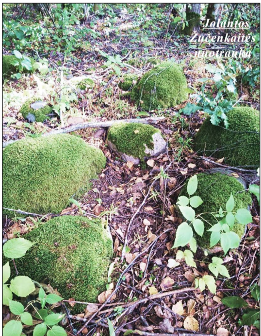
Žalvarių geologinio draustinio rieduliai