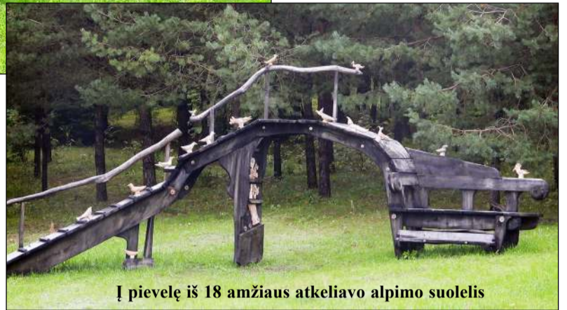
Į pievelę iš 18 amžiaus atkeliavo alpimo suolelis

čiam savyje pasirausti. „Žmonės net patys nustemba, kai pamato, jog pavyksta lipdyti, moka velti arba piešti, drauge ir uždainuoja, - vėl pasakoja šeiminingė, kuriai, aišku, net nereikia sakyti, kad pastarojoje srityje