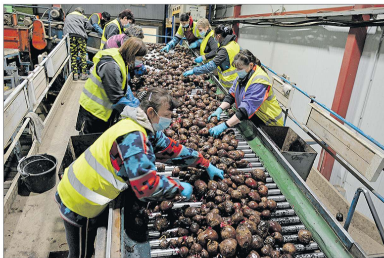
Daržininkystė – žemės ūkio šaka, reikalaujanti didelių lėšų, tad parama, teikiama tuo užsiimantiems, tampa didele pasipirtimi.

Rugsėjo 1–30 d. bus priimamos paraiškos pagal Lietuvos kaimo plėtros 2014–2020 metų programos (toliau – KPP) priemonės „Investicijos į materialųjį turimą veiklos sritį „Parama investicijoms į žemės ūkio produktų perdirbimą, rinkodarą ir (arba) plėtrą“. Šia priemone pasinaudojo ir tuo labai džiaugiasi žemės ūkio kooperatyvo „Jakiškiai“ savininkai bei nariai. Jie tikino, kad be paramos būtų sunkiai įsivaizduojamos „Jakiškių“ veiklos perspektyvos ir išlikimas.