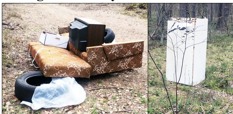
Buities šiukšlių pakelės miškelyje mažėja, bet, deja, dar ne visur...

sunkiai priiima kultūringo vartotojo atsakomybę ir, progai pasitaikius, savo „greitai eigos“ šiukšles palieka ten, kur ir mėgavosi gražiais vaizdais gamtos apsuptyje, arba atvykę stovyklauti į mišką. Tie laikai, kai „gudručiai“, pririnkę priekabą buities, statybos ar automobilių šiukšlių, neturintys gėdos ir sąžinės jausmo, be jokios graužaties jas išverčia kokiame pakelės miškelyje, pamažu baigia pranykti, bet, deja, dar ne visur... Per karantiną, kaip teigia Valstybinių miškų urėdijos Anykščių regioninio padalinio Utenos girininkai-