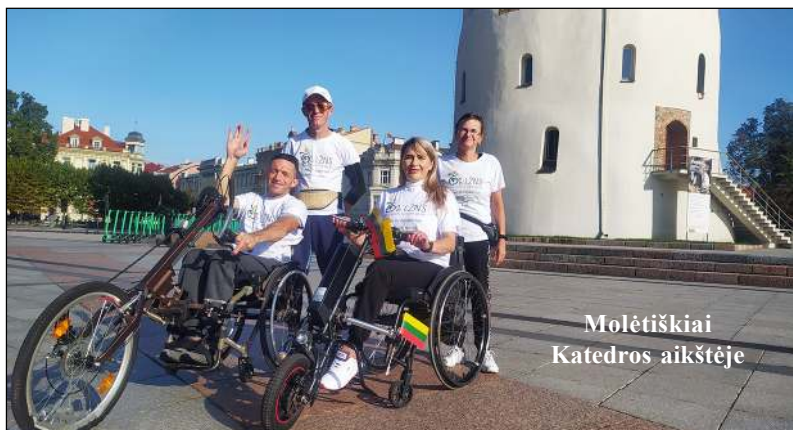
Molėtiškiai Katedros aikštėje