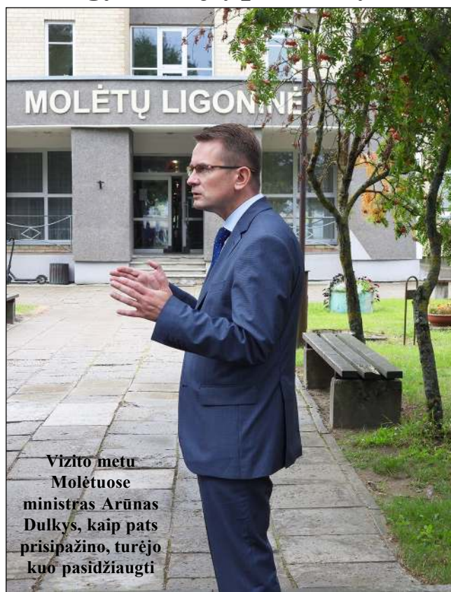
Vizito metu Molėtuose ministras Arūnas Dulkys, kaip pats prisipažino, turėjo kuo pasidžiaugti

Su ministru pavyko susitikti ir trumpai pakalbinti po medžiais prie Molėtų ligoninės. Klausiamas, kokį išpūdį susidarė iš jam pristatytos situacijos mūsų rajono sveikatos sistemoje, ministras sakė, jog aptarta su pandemijos valdymu susijusi tema, kur galėta pasidžiaugti mūsų rajono medikų ir savivaldybės komanda, kuri darė tuos darbus ir veiksmus, kurie kitose savivaldybėse atlikti tik vėlesniuose etapuose, kad didelį dėmesį skyrė mobiliems veiksams. Tai rodo pasiektas rezultatas - savivaldybė yra dešimtuke tarp savivaldybių, kuriose aktyviausiai skiepėjosi žmonės įvairiose amžiaus grupėse, net ir nuo 12 metų. Pasak A. Dulkyo, vyresnioji amžiumi žmonių grupė sunkiau pasiekama visoje šalyje. „Pastebėjome, jog Molėtų rajone naudojamos visos priemonės, kad tik vakcinavimo procesas būtų kuo aktyvesnis ir tai daro tei-