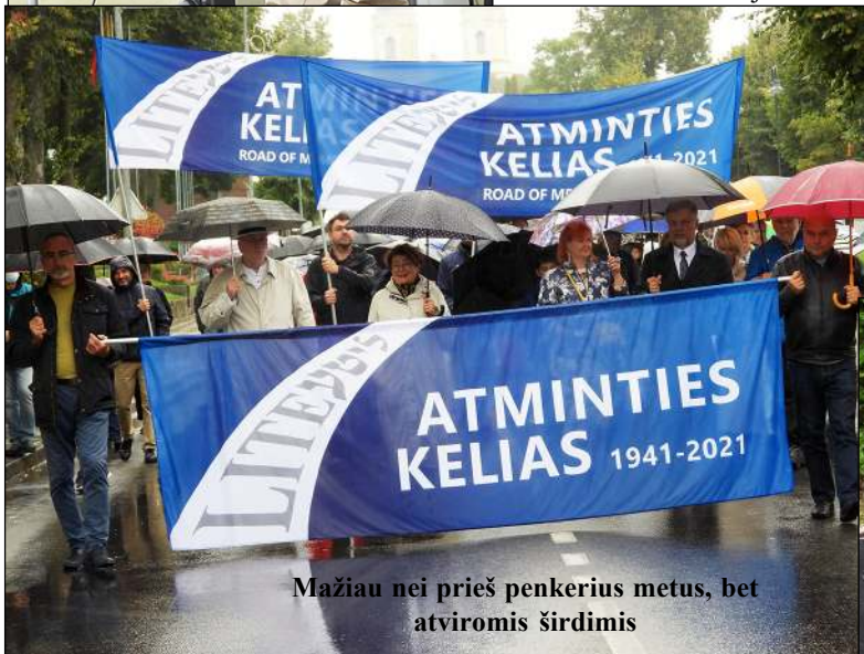
Mažiau nei prieš penkerius metus, bet atviromis širdimis