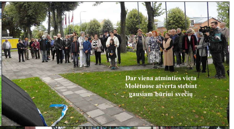
Dar viena atminties vieta Molėtuose atvėrta stebint gausiam būriui svečių.