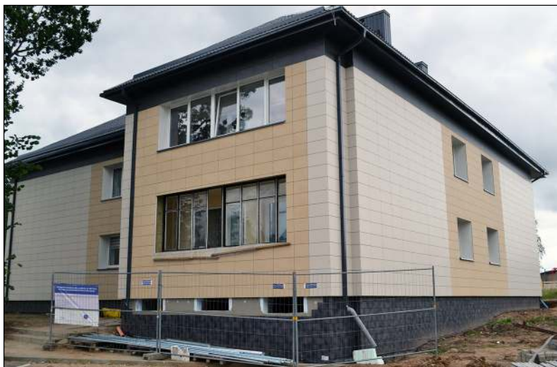
Pastaruoju metu dažnai daugiabučių namų fasadams renkamasi akmenų masės plytelės

Rajono savivaldybės administracija įvykdė pirkimus dviejų gatvių remontui. Viena iš jų – Giedraičiuose bus rekonstruojama Maumedžių gatvė, kita - Molėtuose – tvarkoma Kreivoji. Dėl darbų šiose gatvėse pasirašyta darbų sutartis su viešuosius konkursus laimėjusiomis AB „Kelių priežiūra“ ir UAB „Melingos keliai“. Pirmoji darbuosis Giedraičiuose, kur Maumedžių gatvėje bus įrengti šaligatviai ir važiuojamosios dalies remontas. Rekonstruojant gatvę bus įrengtas naujas apšvietimo tinklas su LED šviestuvais, automobilių stovėjimo aikštelė ir kt. iš viso už 77,6 tūkst. eurų. Giedraičiuose nauja gatvė galės džiaugtis kitų metų vasarą, nors dar šiemet ketinama pakloti asfaltą ir įrengti apšvietimą.