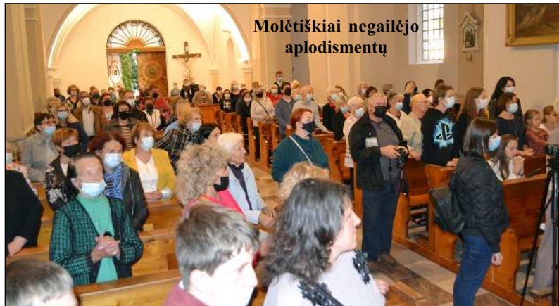
Molėtiškiai negailėjo aplodismentų