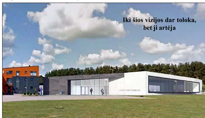
Iki šios vizijos dar toloka, bet ji artėja