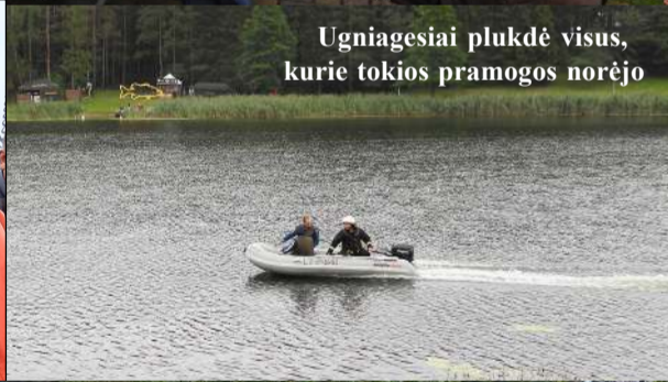
Ugniagesiai plukdė visus, kurie tokias pramogas norėjo