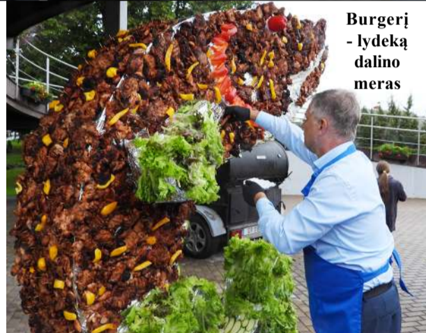
Burgerių - lydeką dalino meras