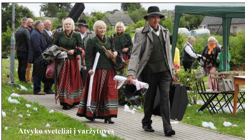
Atvyko sveteliai į varžytuves