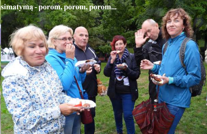
Į pasimatymą – porom, porom, porom...