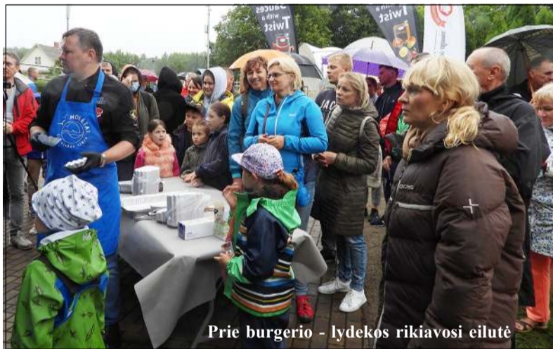
Prie burgerio - lydekos rikiavosi eilutė