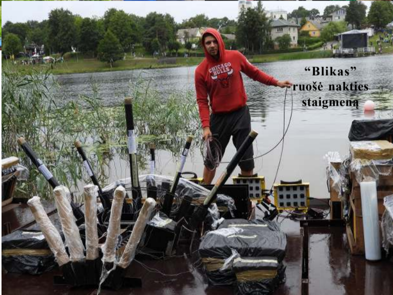
„Blikas“ ruošė nakties staigmeną