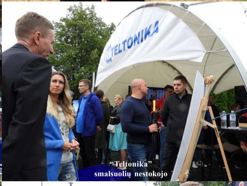
„Teltonika“ smalsuolių nestokojo