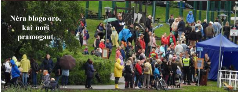
Nėra blogo oro, kai nori pramogaut