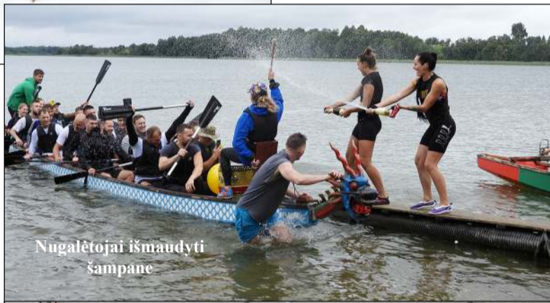
Nugalėtojai išmaudyti šampane