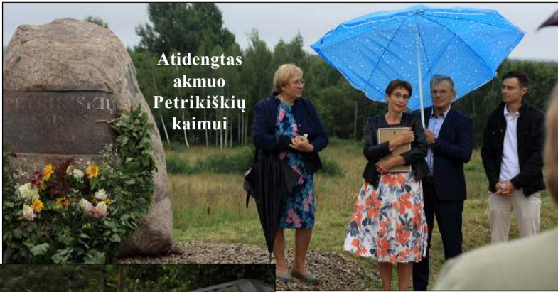
Atidengtas akmuo Petrikiškių kaimui