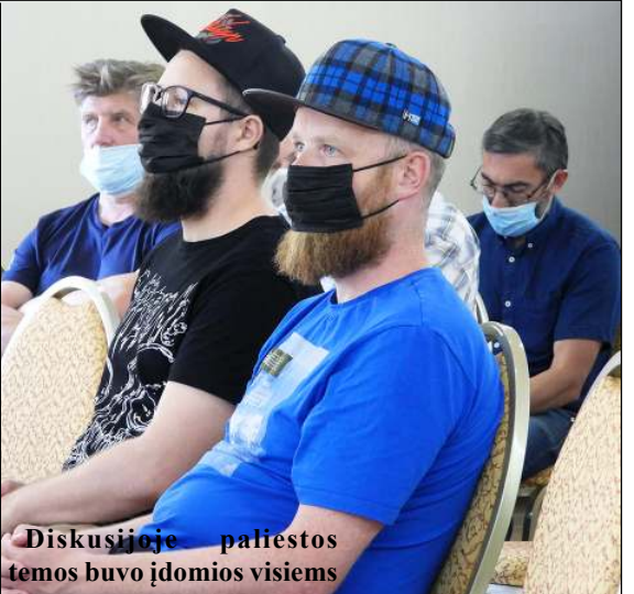
Diskusijoje paliestos temos buvo įdomios visiems