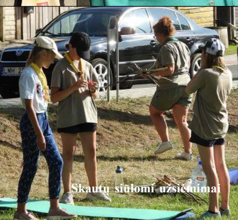
Skautų siūlomai užsiėmimai