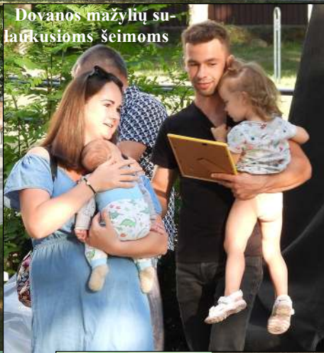
Dovanos mažylių su-laikykoms šeimoms