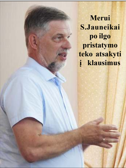
Merui S. Jauneikai po ilgo pristatymo teko atsakyti į klausimus

kalbama ministerijoje apie pilotinį projektą, kuomet atsakiusiam darbo siūlymo žmogui