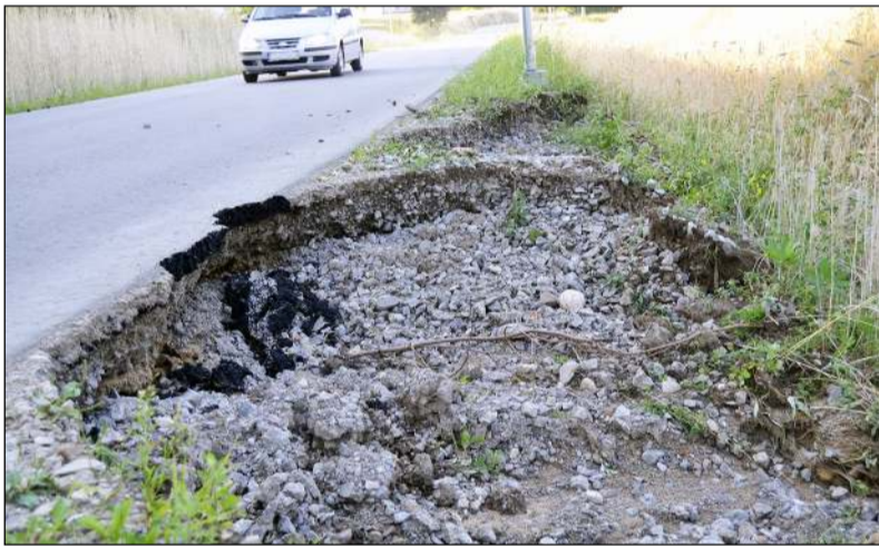
Po liūtis išplovus gatvės pagrindus, lūžo asfaltas