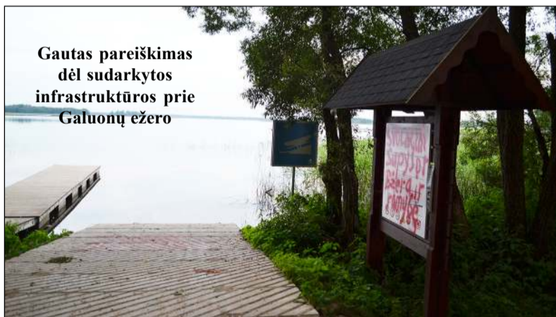
Gautas pareiškimas dėl sudarkytos infrastruktūros prie Galuonų ežero

Pranešimų policijai skaičius praėjusią savaitę buvo rekordinis – iš viso gauta bei reaguota į 146 pranešimus ir tokia pranešimų gausa, kai jų registruojama du ir tris kartus daugiau negu įprastai, išskirtinai būdinga tik vasarai... Savaitgalyje siautėjo ne tik gamtos stichija, dėl kurios nuverstų medžių ant važiuojamųjų kelio dalių pagalba kviesta dešimtį kartų, bet ir žmonės, nes vien per savaitgalį buvo gauti 72 pranešimai! Deja, neišvengta ir įskaitinių eismo įvykių, kuriuose nukentėjo žmonės. Sekmadienį, prieš vidurdienį Giedraičių miestelyje, Vilniaus ir Maumedžių gatvių sankryžoje, 29 metų vyras su motociklu „Suzuki“, lenkdamas automobilį, pirminiais duomenimis, nepastebėjo, kad priekyje dar vienas važiuojantis automobilis „Audi A6“ suko į kairę, dėl to nespėjo sustoti ir atsitrenkė į jo galinę dalį. Nukentėjo dviratės transporto priemonės vairuotojas. Penktadienį apie