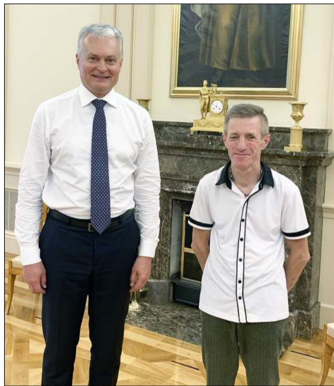
Arvydas pristatė šalies Prezidentą Gitaną Nausėdą

Socialinės įdarbinimo agentūros „SOPA“ projekte „DuoDay“, kai vienai dienai įmonės ir organizacijos kviečia žmones su negalia išsibandyti įvairius darbus, dalyvavę Molėtų krašto žmonių su negalia sąjungos (ŽNS) negaliejį darbavosi Molėtų bibliotekoje,