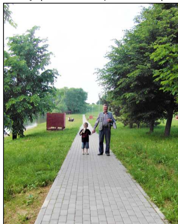
Poilsio vietė prie Alaušų

pateikusios ir savo nuotrauką, kurios neįdėjome, bet pateikiame dabar, prašymą atitaisyti klaidą. „Žmonės tie patys, bet rašinio kontekstas kitas. Pasakysiu grubiau: ar galio kalbėti apie Balninkus įdėdama