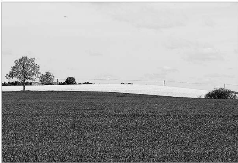
Žemdirbiai dažniausiai linkę drausti javus ir rapsus.

Pasėlių ir augalų draudimo įmokos kompensuojamos iš dviejų šaltinių: ES lėšų bei nacionalinio biudžeto. Iš ES lėšų – draudimas nuo iššalimo ir (arba) stichinės sausros padarinių, paramos intensyvumas