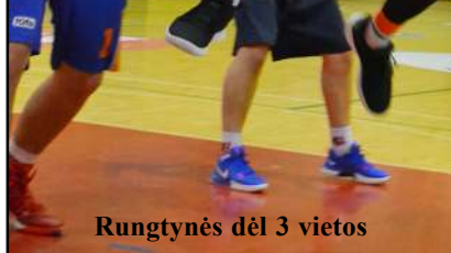
Rungtynės dėl 3 vietos