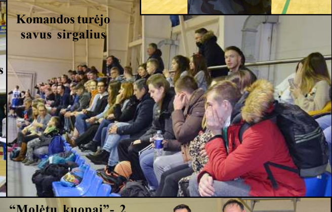
Komandos turėjo savus sirgalius