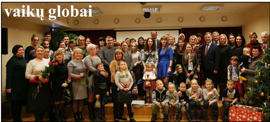
Jautrus ir šiltas Padėkos vakaras galbūt taps gražia tradicija

Molėtų vaikų savarakiško gyvenimo namuose praėjusią savaitę būta neeilinio įvykio, prieššventinį šurmulį čia solidžiai užpildė pirmą kartą surengtas (tiesa, su viltimi, kad ateityje tai taps tradicija) padėkos vakaras "Globa - geriausia vai-