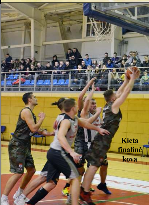
Kieta finalinė kova