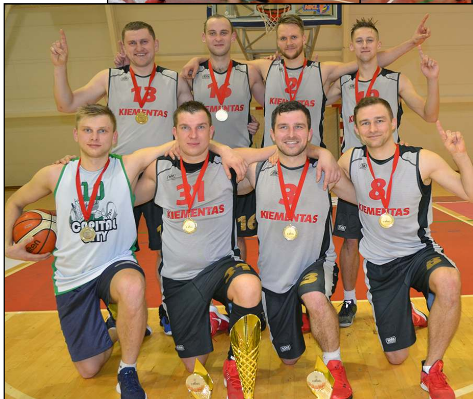
Ilgai siektas tikslas - "Vilnies" taurė - giedraitiškių rankose!