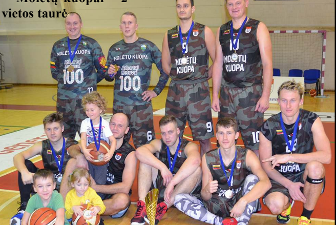
"Molėtų kuopai"- 2 vietos taurė