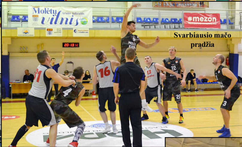
Svarbiausio mačo pradžia