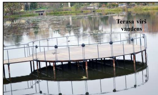
Terasa virš vandens

sų treniruoklių neišbandėme, nes jie dar, ko gero, nepabaigti įrengti, bet į žemę įleistas batutas puikiai nutaikė, juk smagu ir vyresniame amžiuje saugiai pastrikinėti. Greta šios šaušios poilsio aikštelės Pastovėlio ežere įrengta ovali aikštelė – terasa virš vandens, kurioje galima gėrėtis vaizdu. Tik iki aikštelės nėjome, mat šlaitas ir pakrantė užsėta žolė – nesinorėjo mindyti tvarkingos aikštelės ir palikti savo pėdas... Apžiūrint naujus įrenginius ir su pro šalį ėjusiais molėtiškiais pabendravome. Pasak vieno iš jų, čiuożykla – „tik kojoms nususukt...“. Antrasis pašnekovas