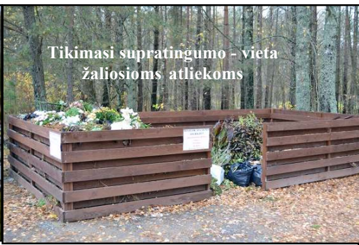
Tikimasi supratingumo - vieta žaliosioms atliekoms