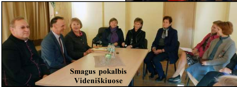
Smagus pokalbis Videniškiuose

Žiūrų, Kijėlių, Luokesos gyvenvietėse, susitiko su verslo, kaimo turizmo atstovais, ūkininkais Antalakajos, Juodakampio, Pagrabuosčių, Smėlinkos, Duobužių, Ažušilių, Kašėkių kaimuose.