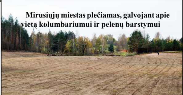
Mirusiųjų miestas plečiamas, galvojant apie vietą kolumbariumui ir pelenų barstymui