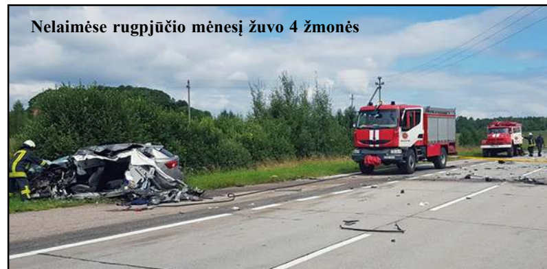
Nelaimėse rugpjūčio mėnesį žuvo 4 žmonės

tvenkinyje nuskendusį žmogų. 2016 metais rugpjūčio mėnesį vyko į 16 iškvietimų, o 2015 metais buvo 19 pranešimų, tačiau tragiškų nelaimių išvengta. Akivaizdu, kad šių metų rugpjūčio nelaimių statistika išskirtinai didelė, bet reikia pastebėti, kad šiais metais pastebimas ryškus incidentų skaičiaus augimas. 2015 metais nuo sausio 1 iki rugpjūčio 31 d. ugniagesiai gelbėtojai kviesti 141 kartą, 2016 metais per tą patį laiko-