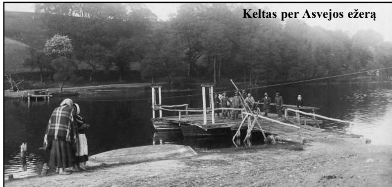
Keltas per Asvejos ežerą