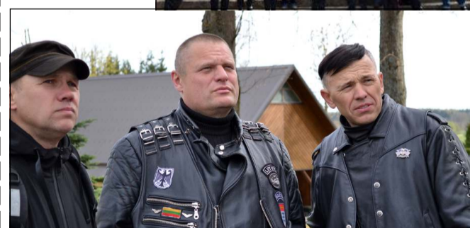
"Molmoto" klubo nariai palaiko gražią iniciatyvą

ninkų, pasiryžusių įveikti per 200 km žygyje "Suk rankeną Lietuvos šimtmečiui". O kadangi šis žygis buvo skirtas valstybės jubiliejui, kelionė tęsėsi lankant istorines vietas. Pirmiausia kolona stabtelėjo 680 metų menančiuose Giedraičiuose, paskui - Musninkuose pagerbiant Lietuvos Nepriklausomybės akto signataro Alfonso Petručio šviesų atminimą, Žasliuose - senoje miestelio aikštėje žydų sušaudymo vietoje. Kaišiadoryse motociklininkai dalyvavo Eucharistijoje prie (Nukelta į 3 psl.)