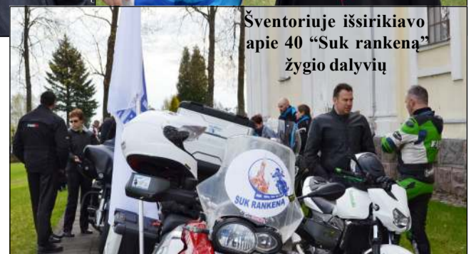
Šventoriuje išsiriškiavo apie 40 "Suk rankeną" žygio dalyvių

ninkų, pasiryžusių įveikti per 200 km žygyje "Suk rankeną Lietuvos šimtmečiui". O kadangi šis žygis buvo skirtas valstybės jubiliejui, kelionė tęsėsi lankant istorines vietas. Pirmiausia kolona stabtelėjo 680 metų menančiuose Giedraičiuose, paskui - Musninkuose pagerbiant Lietuvos Nepriklausomybės akto signataro Alfonso Petručio šviesų atminimą, Žasliuose - senoje miestelio aikštėje žydų sušaudymo vietoje. Kaišiadoryse motociklininkai dalyvavo Eucharistijoje prie (Nukelta į 3 psl.)