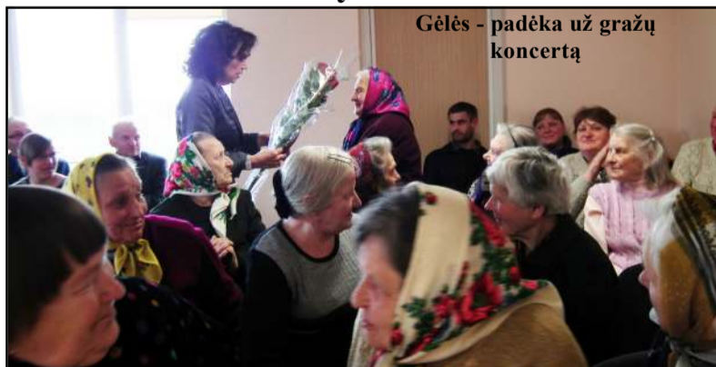
Gėlės - padėka už gražų koncertą

Turite naujienų? Rašykite mums el.p. info@vilnis.lt Norite naujienų? Skaitkite "Vilnį"! Draugaukime!