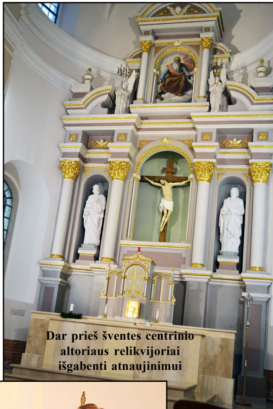
Dar prieš šventes centrinio altoriaus relikvijoriai išgabenti atnaujinimui

-Labai džiaugiuosi, kad kitais metais, kuomet minėsime Lietuvos valstybės atkūrimo šimtmetį, Molėtų bažnyčios vidus bus atnaujintas, - kalbėjo monsinjoras,