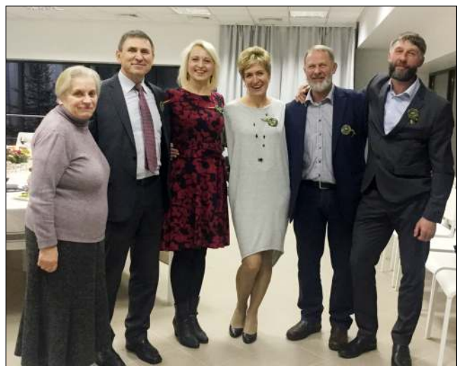
Alantiškiai svečiuose buvo priimti itin draugiškai

Praėjusį penktadienį Palūšės turizmo centre "Campus Viridius" iškilmingu šventiniu renginiu buvo baigtas šio kaimo, kaip 2017 metų Lietuvos mažosios kultūros sostinės gyvavimo laikas. Garbin-