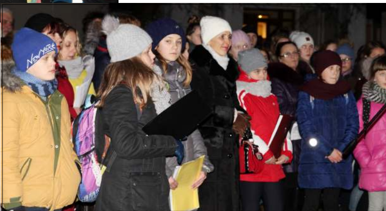
Jaunieji molėtiškiai menininkai ir po daugelio metų savo gimtajame mieste ras dalelę savo sukurto kraštui palikimo

Praėjusį antradienį Molėtų kultūros centro fojė vaikams ir jų tėveliams buvo siūloma pasigauti Kalėdas. Tik šį kartą į renginį vaikai sugužėjo ne su tėveliais, o su mokytojais. Dvi Molėtų pradinės mokyklos auklėtinių klasės smagiai leido laiką ne tik su žaisminga ir šmaikščia, Molėtų kultūros centre šventiniu laikotarpiu apsigyvenusia sniego gniūžte, bet ir su Molėtų viešosios bibliotekos Vaikų literatūros skyriaus gyventoja Molinuke bei visų ilgai lauktu Kalėdų seneliu. Graži Molėtų kultūros centro ir Vaikų lite-