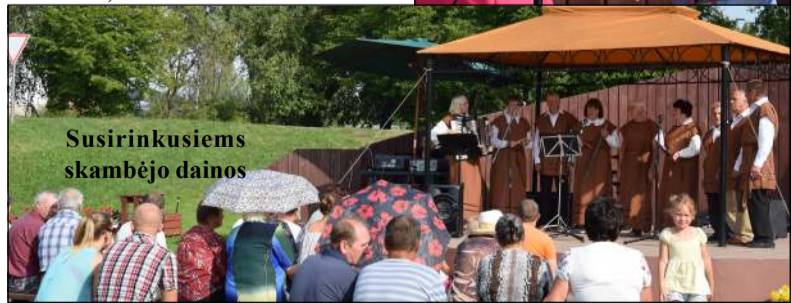
Susirinkusiems skambėjo dainos