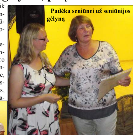
Padėka seniūnei už seniūnijos gėlyną