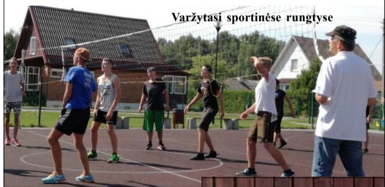
Varžytasi sportinėse rungtyse

Šeštadienį į Bekupės bendruomenės centro aikštę būrėsi jaunimas ir vyresnio amžiaus bekupiečiai, kad visi drauge sudalyvautų vasaros palydų šventėje. Nuo pat ryto čia vyko sporto varžybos, o pirmiausia į kovą stojo krepšinininkai - iš viso į krepšinio varžybas registravosi 7 komandos, kurios kovojo dėl geriausių vardų. O po aktyvios kovos paaiškėjo, kad III vieta teko komandai "Duobė", II - "Kiemento suoleliui", o I - "Kiementas". Visos ko-