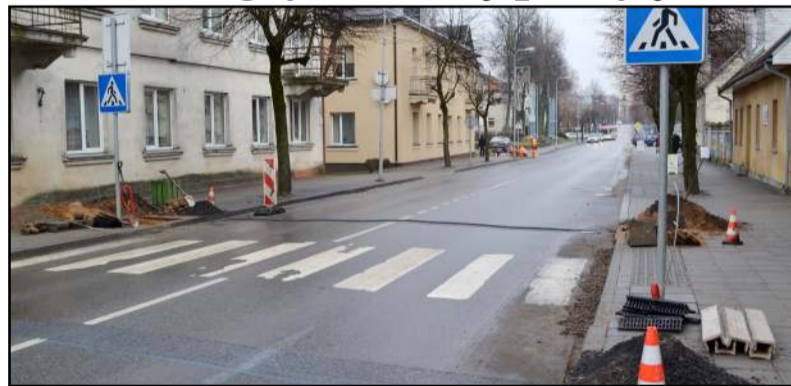
Vilniaus gatvėje naujai įrengta trapecinė perėja - jau ketvirtoji

Praėjusią savaitę Vilniaus ir Inturkės gatvėse, Molėtuose vyko trapecinių perėjų įrengimo darbai, kuriuos vykdė UAB "Tvirta". Jau anksčiau buvo atlikti parengiamieji darbai - nuleisti šaligatvių bortai, įrengta neregijų vedimo sistema, sumontuoti apšvietimo kabeliai, pamatai apšvietimo šviestuvams... Savaitės pabaigoje minėtose gatvėse jau buvo suformuoti perėjų iškilumai, pastatyti ati-