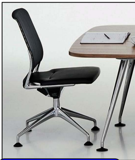
Devyni kandidatai į vieną kėdę

Rinkimų kampanija paprastai pažeria visko - nuo emocijų iki radikalių pasisakymų. Būta jau pirmojo plykstelėjimo ir mūsų krašte, kuomet "susikabinta" dėl neva esančio partinio intereso istorijoje su Balninkų miestelio keliuko dingimu... Toliau - tylu, nes, matyt, dar ne laikas, rinkė-