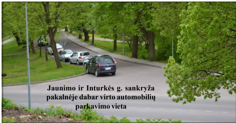
Jaunimo ir Inturkės g. sankryža pakalnėje dabar virto automobilių parkavimo vieta

Molėtų miesto centre, prie "raudonų mūrų" bandyti darbo valandomis parkuoti automobilį - sunkus uždavinys. Už "raudonų mūrų" ir greta Vilniaus gatvės esančios automobilių parkavimo aikštelės - nuolat sausakimšos. Problema pastaruoju metu dar labiau paaštrino Vasario 16 - osios gatvės ir kultūros namų pastato remonto darbai, nes dėl jų ir užkulisinės nedidukės aikštelės prie kultūros namų, "Sodros" tapo nebesiekiamomis arba jomis negalima naudotis dėl statybos dar-