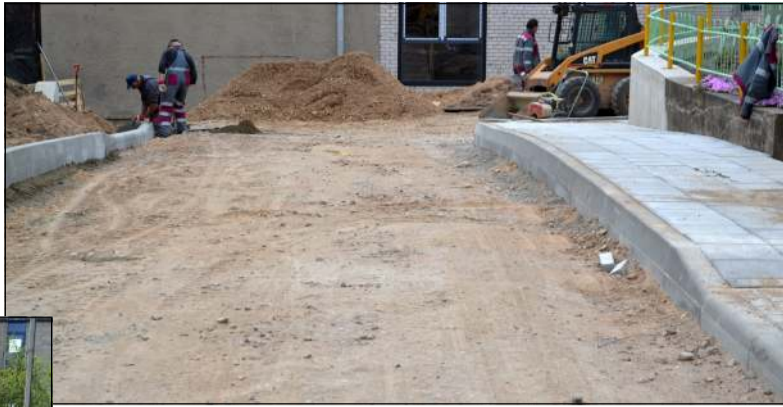
UAB "Aukštaitijos traktas" darbus turėtų baigti birželio viduryje

Pagal sutartį statybos darbus rangovas UAB "Aukštaitijos traktas" turės užbaigti birželio mėnesio viduryje. Šios gatvės yra naudojamos gyventojų kasdieniam susisiekimui: privažiavimams prie gyvenamųjų namų, link švietimo įstaigų bei naujai pagal 2007 - 2013 metų Europos Sąjungos struktūrinę paramą rekon-