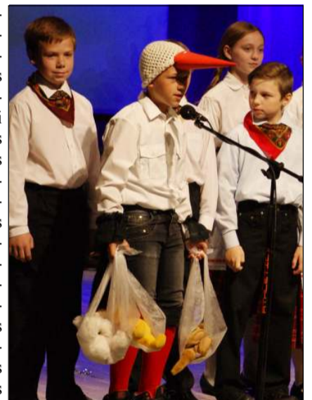
Tikra Šeimos diena: scenoje - vaikai ir tėvai...

Tradiciškai Šeimos dienos išvakarėse nepakartojamą šou tėveliams, seneliams, draugams surengė Molėtų pradinės mokyklos bendruomenė, padovanojusi renginį "Mums smagu, kai mes visi kartu". Sausakimšoje kultūros centro salėje beveik pusantros valandos netilo ovacijos ir aploksimentai mažiesiems dainorėliams ir šokėjams, kurie iš visos širdies demonstravo tai, ką mokėsi su savo mokytojais ir draugais. Paraginę visus sugrįžti į vaikystės miestą, mokiniai susirinkusiems pateikė siurprizą, nes vaikams senelės pasaką kitaip padėjo kurti ir tėveliai. Tečiai kelioms akimirksmams virto pusnynuos