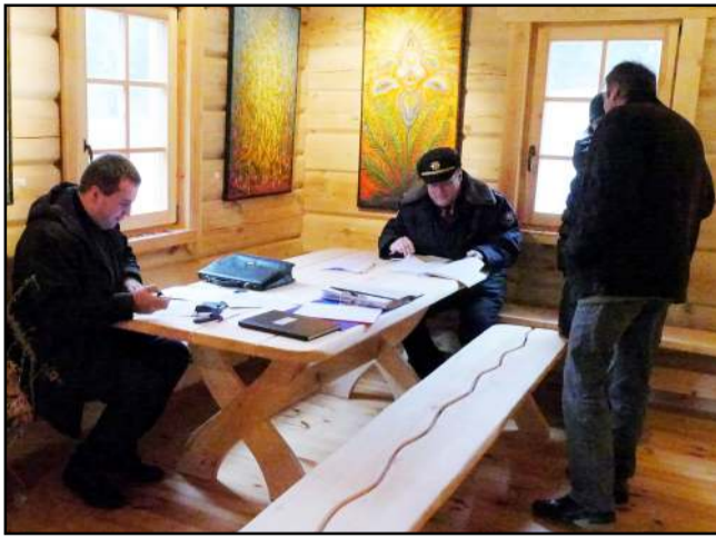
Rangos darbus atliko UAB "Mindaivos statyba". Komisija apžiūrėjo