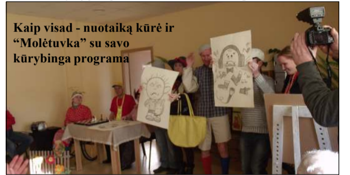
Kaip visad - nuotaiką kūrė ir "Molėtuvka" su savo kūrybinga programa

užimtumo ir integracijos cen- tro nariai, atvežę savo darbų parodą, ne tik savo darbelius eksponavo, bet ir spektaklį "Žalia pasaka" dovanojo Kijė- lių spec. ugdymo centro lan- kytojai, plojimų negailėta "Mo- lėtuvkos" spektakliui, vokali-