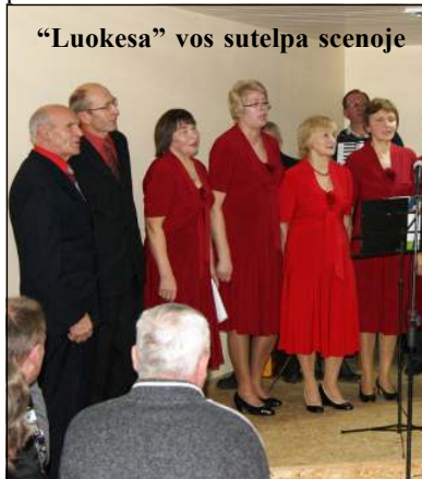
"Luokesa" vos sutelpa scenoje

rybių ir amatų mugėje, kartu pasigendant didesnio aktyvumo, nes pastangų ir geranoriškumo labai reikia, prisiminti visi šiųmečiai rengi-