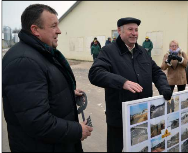
"Rimosta" vadovai prisiminimui įteikė nuotraukų stendą ir raktą