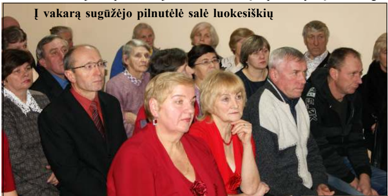
Į vakarą sugūžėjo pilnutėlę salę luokesiškių

veda 2 proc. gyventojų pajamų mokesčio. "Bendruomenės centre yra registruoti 39 nariai, tačiau dalis jų mažai aktyvūs, tad ir nario mokesčio mokėti neskuba. Vietos bendruomenėms skiriamos lėšos irgi šiemet dalintos jau keturiems BC, kadangi visi nori gauti pinigėlių pasitvarkyti ar įsigyti būtiniausioms prekėms", - sakė seniūnė, pabrėžusi, kad Luokesos seniūnija yra išskirtinė, net neaišku, ką reikėtų vadinti jos centru, bet kartu pasidžiaugė, kad daugėja bendruomenių centrų, vadinasi, graži šeima auga. Pristačius atskaitą, vienas po kito