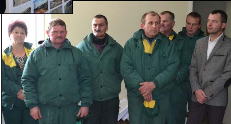
Visi darbuotojai antagaluoniškiai, visi buvo įvertinti ir sulaukė padėkos