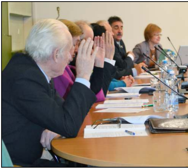
Dauguma sprendimų priimta be diskusijų ir vienbalsiai

Pernai atsiliepię į Aplinkos ministerijos kvietimą projektui neabejingi visuomenės nariai padėjo išrinkti jo pavadinimą. Planai sukurti patrauklią ir turistams, ir žvejams mėgjamą vietą, kartu puoselėjant ir tausojant gamtą, pavadinti "Žvejybos rojumi". Pasirinktos ir savivaldybės, tapsiančios tikru rojumi žūklės mėgėjams. Viena iš jų - mūsų rajonas. Dabar gi turintieji idėjų, kaip turėtų atrodyti "Žvejybos rojus" lo-