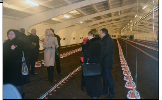
Atidarymo svečius stebino viščiukų įkurtuvėms parengtų erdvių modernumas ir jose tvyranti šiluma

investicijų mūsų krašte, kas galbūt jau atsargiai ir planuojama, ir įteiktas įpareigojantis ženklas su priminiu, kad "Molėtai, čia viskas tikra..." Žemės ūkio minist-