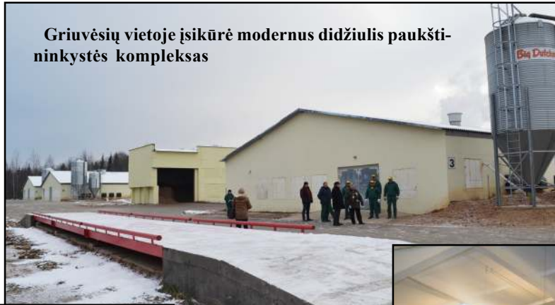
Griuvėsių vietoje įsikūrė modernus didžiulis paukštinkystės kompleksas

nansiniais re-sursais ateina į Molėtų kraštą, sukurdami naujas veiklas, darbo vietas, - kalbėjo meras. - Mūsų rajono savivaldybė siekia sudominti kuo daugiau investuotojų ir su-