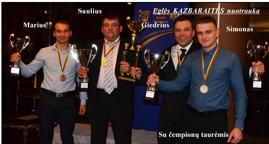
Su čempionų taurėmis

Kaune praėjusį šeštadienį Lietuvos automobilių sporto federacijos kroso komitetas apdovanojo Lietuvos, Baltijos ir NEZ automobilių kroso ir ralio kroso nugalėtojus bei prizinkus. Šioje apdovanojimų ceremonijoje pirmą kartą Lietuvos čempionato istorijoje triumfavo molėtiškiai - Skorpiono automobilių sporto klubo komanda tapo