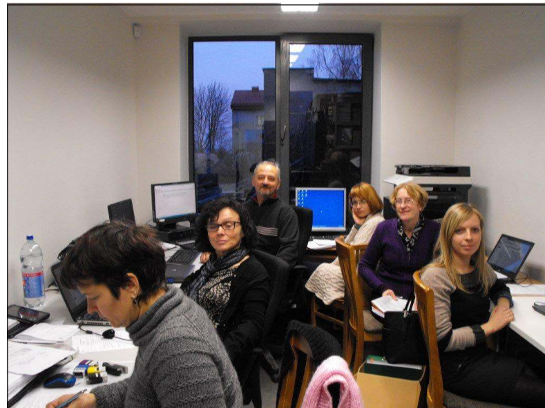
Muziejininkai sau tinkamą laikiną erdvę turėjo išsikvoti

Renovacijai išibėgėjant, šią vasarą savo turimas patalpas turėjo atlaisvinti krašto muziejaus darbuotojai. Jie draugiškai išsikūrė buvusios suvenyrų krautuvėlės patalpose. Parodos ir toliau organizuotos Dailės galerijoje, tačiau dalis muziejaus veiklos, susijusios su turėta ekspozicija, buvo sustabdyta, tačiau tai puikiai kompensavo pagal muziejaus parengtus ir laimėtus projektus vykdyta veikla, renginiai, o atvykę poilsiautojai, turistai buvo raginami apsilankyti Medžioklės ekspoziciją bei amatų centrą Mindaunoose, pabuvoti kituose muziejaus padaliniuose. Rudenį startavo dar vienas kraustymosi etapas, kurio metu muziejaus darbuotojai turėjo išsikelti į Molėtų progimnazijoje jiems skirtas kelias klases, savo vietą užleisdami kultūros