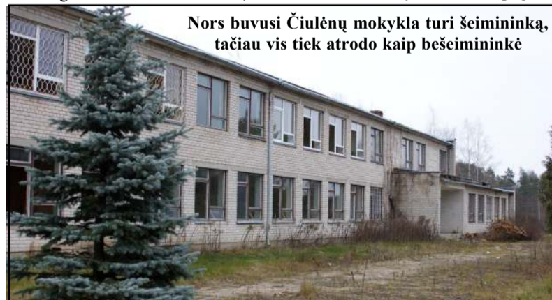
Nors buvusi Čiulėnų mokykla turi šeiminką, tačiau vis tiek atrodo kaip bešeimininkė

po nebereikalingi. Griūvant bendrovėms, pastatai dalimis arba visi buvo išdalinti gyventojams už vadinamuosius pajus, todėl dauguma jų tapo pasmerkti pražūčiai. Taip atsir-