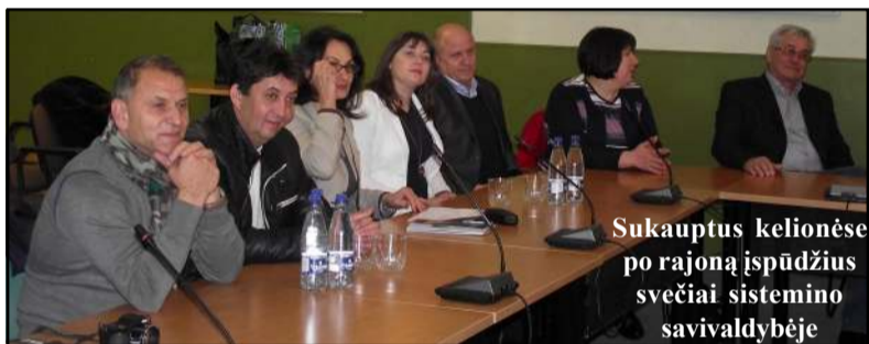
Sukauptus kelionėse po rajoną įspūdžius svečiai sistemino savivaldybėje

Praėjusią savaitę kelias dienas Molėtuose viešėjo Moldovos Ungheeni rajono delegacija. Su šiuo rajonu prieš kelis metus Molėtų savivaldybė pasirašė bendradarbiavimo sutartį, o bendrystė startavo pirmiausia kultūrine prasme, mat Ungheeni rajono delegacija kartu su meno kolektyvais dalyvavo tarptautiniame liaudiškos muzikos ir šokių festivalyje "Ežerų sietuva", o pernai vasarą gautas kvietimas molėtiškiams sudalyvauti jų miesto dienų renginiuose, kur vyko mūsų rajono delegacija kartu su kūrybišku jaunimu. Kaip sa-