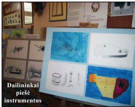
Dailininkai piešė instrumentus