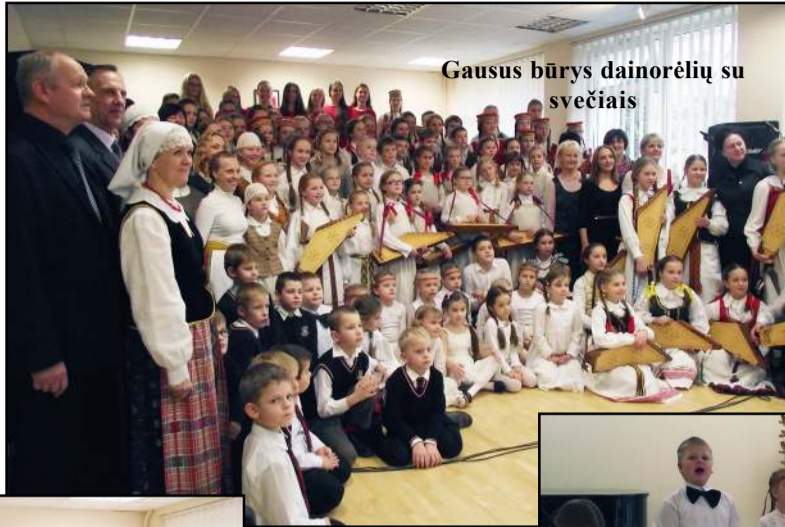
Gausus būrys dainorėlių su svečiais

Molėtų menų mokykloje praėjusią savaitę įvyko trečiasis respublikinis vaikų ir jaunimo lietuvių liaudies dainų festivalis "Giedu dainelė - 2014", sukviėtęs į bendrą būrį ne tik molėtiškius dainorėlius bei liaudies instrumentais grojančius liaudiškų tradicijų puoselėtojus, bet sulaukta ir svečių iš Utenos, Alytaus, Vilniaus. Beje, Dailės skyriaus mokiniai pasistengė įamžinti drobėje liaudiškos muzikos instrumentus, kurie traukė visų akį. Pirmiausia visus subūrus bendrai fotonuotrukai, kurioje didžiulis būrys vaikų ir jų vadovų vos besutlpo, netrukus nu-