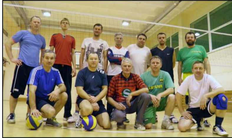
Nuotaikinga ir draugiška joniškietė, dubingiškietė, giedraitė ir molėtiškietė kompanija kiekvieną pirmadienį renkami žaisti tinklinio