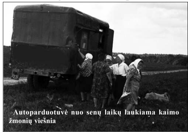
Autoparduotuvė nuo senų laikų laukiama kaimo žmonių viešnia