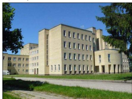
Molėtų ligoninei kol kas vadovaus laikinas vadovas Greitosios medicinos pagalbos centro direktoriaus postui užimti tai-