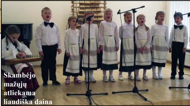
Skambėjo mažųjų atliekama liaudiška daina

go pasipylė vieni kitus keitę pasirodymai, kurių metu džiugino patys mažiausi - lopšelių darželių "Saulutė" ir "Vyturėlis" auklėtinių pasirodymai, Molėtų pradinės mokyklos vaikų etnografinė grupė bei etnografinis ansamblis, savo pasirodymu stebino kultūros centro berniukų ansamblis. Nuo mažųjų atlikėjų, kurių pasirodymus vienijo tai, kad dainelėms pritarė kanklėmis, neatsilikę ir vyresni - Molėtų progimnazijos merginų kvartetas, Menų mokyklos auklėtiniai, Molėtų gimnazijos etnografinis ansamblis, solistė