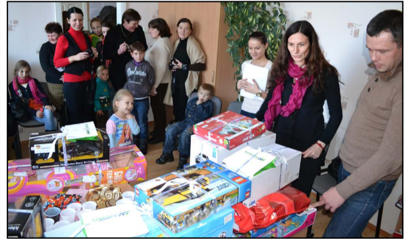
Praėjusiais metais molėtiškių vaikų svajonės pildėsi su kaupiu

žieji molėtiškiai svajoja apie žaislus, su kuriais galėtų žaisti, kurie taptų jų draugais: "Labai norėčiau didelės mašinos. Kai grįžtu iš darželio, būna labai liūdna, kol sesės ruošia pamokas ir nežaidžia su manimi. Tada važinėčiau su mašina...", "Noriu didelės lėlės, ji būtų mano draugė, nes broliai su manimi nedraugauja...", "Noriu didelio meškio, su juo miegočiau, jį apkabinačiau, o jis mane saugotų". O štai mažiausioji 2 metų svajotoja turi labai konkretų norą: "Noriu šiltos antklodės ir gražios patalynės su lėlytėmis". Šiais metais atsirado nauja svajonė ir tapo labai populiori tarp mergaičių: "Labai no-