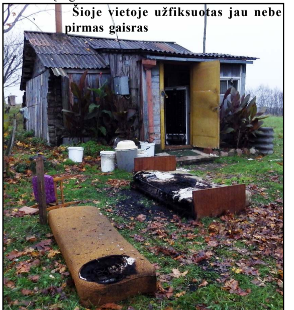
Šioje vietoje užfiksuotas jau nebe pirmas gaisras