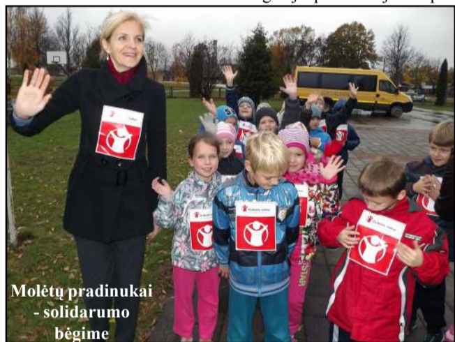
Molėtų pradinukai - solidarumo bėgime

Praėjusį ketvirtadienį Molėtų pradinės mokyklos bendruomenė, prisidėdama prie "Gelbėkit vaikus"