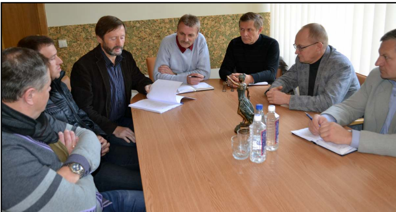
Solidžiam išmanymu sambūryje nestigo nei aštresnių pasisakymų, nei dalykiškų diskusijų

Kalbėta ir apie kitą kelią, kurio prireiktų, jeigu nebūtų surastas kompromisas geranoriškai. Tai - teisinis kelias, kuris pavirstų į ilgą procesą, nepriimtina ir žmonėms. Be to, pastarasis iškilusių projekto įgyvendinimo problemų sprendimo būdas turėtų negerų pasekmių. Mat