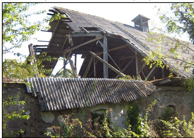
Klabinių dvaro sodybos pastatų būklė - avarinė

garsus Valiuko akmuo. Tai mitologinė vertybė. Džiaugiuosi, kad seniūno rūpesčiu sutvarkyta teritorija aplink akmenį ir išskirtas miško takas link jo. Utenos miškų urėdijos darbuotojų pagalbos dėka buvo surastas Avilčių miške esantis akmuo su žmogaus pėda.