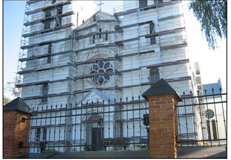
Alantos šv. Jokūbo bažnyčios fasadas dėl dažymo darbų "pasipuošė" pastoliais