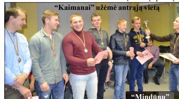
"Kaimanai" užėmė antrąją vietą