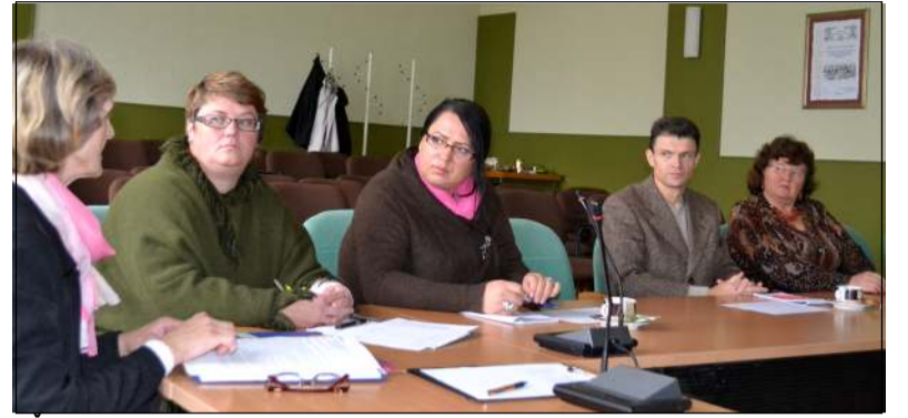
Šiemet socialinės rehabilitacijos paslaugų neįgaliesiems bendruomenėje projektų finansavimui skirta 145 tūkst. litų