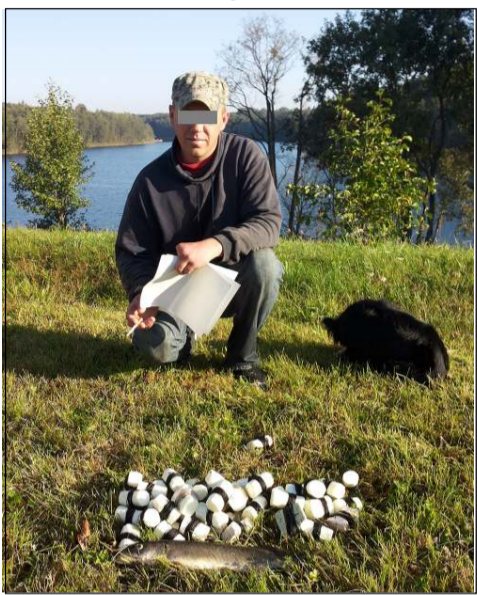
Laimei, kad ant daugybės plūdurų "užkibo" tik viena lydeka...

Utenos RAAD Gyvosios gamtos apsaugos inspekcijos pareigūnas pasiekė informaciją, kad Molėtų rajone esančiame Krakavo ežere žvejojama nepaisant Mėgėjų žvejybos vidaus vandenys taisyklių reikalavimų. Buvo priimtas sprendimas šią informaciją patikrinti. Anksčiau rytą nuvykę prie šio vandens telkinio ir jį kruopščiai apžiūrėję, pareigūnai vienoje ežero pusėje suskaičiavo net 35, matyt, iš vakaro pastatytus, plūdurėlius. Mėgėjų žvejybos taisyklių 6 punkte aiškiai nurodoma, kad vienu metu žvejyboje vienas žvejys gali naudoti ne daugiau kaip 4 mėgėjų žvejybos įrankius, o