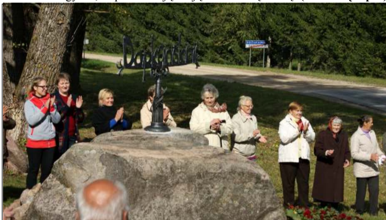
Dapkūniškiečių bendrystė išryškėjo paminklinio akmens apjuosime

Praėjusio trečiadienio popietę Dapkūniškių kaimo kryžkelėje, kur susikerta net trys keliai, atidengtas ir pašventintas ant akmens iškaltas kaimo pavadinimas, nuo šiol būsiąs šio krašto pagrindiniu akcentu, bylojančiu, kad kaimas gyvas, kupinas naujų idėjų bei bendrų darbų. (Nukelta į 2 psl.)