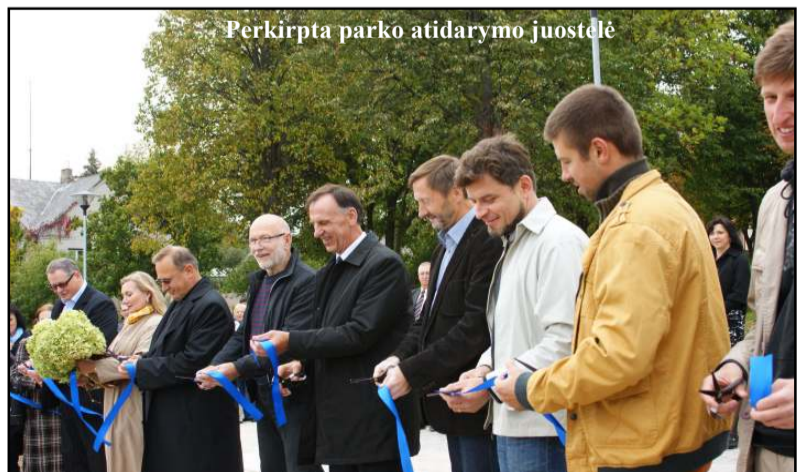
Perkirpta parko atidarymo juostelė