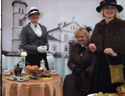
Prie stalo kvietė Alantos damos

šiuo kartu vertinti turėjo gėdintis prijuostę, išrinkti spalvingiausią eiseną ir išradingiausią kiemelį. "Mums buvo sunkiau vertinti negu jums pasirengti šventei," - atviravo komisijai pirmininkavęs meras, paskelbęs ne tik nominacijų nugalėtojus, bet ir pamintė, kam komisija skyrė antrą ir trečią vietas. Dėkavonė už spalvingiausią eiseną šiuo kartu atiteko Alantos seniūnijai, kuri aplenkė Luokesos ir Dubingių seniūnijų eisenas. Išradingiausiu kiemeliu paskelbtas Joniško kiemelis, bet komisijai patiko ir pas mindūniškus bei balninkiečius. O išpūdingiausią gospadinę prijuostę šventėje pristatė videniškėčiai, komisija dar išskyrė luokesiškių ir inturkiškių prijuostes. Išdalinus dėkavones ir