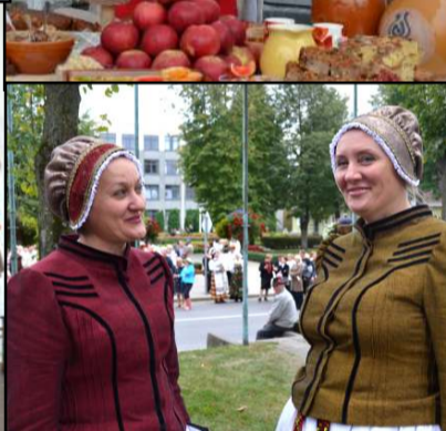
Šventės gospadinės Laisvė ir Indrė poemos "Metai" ištrauka... "Vilnius" informacija