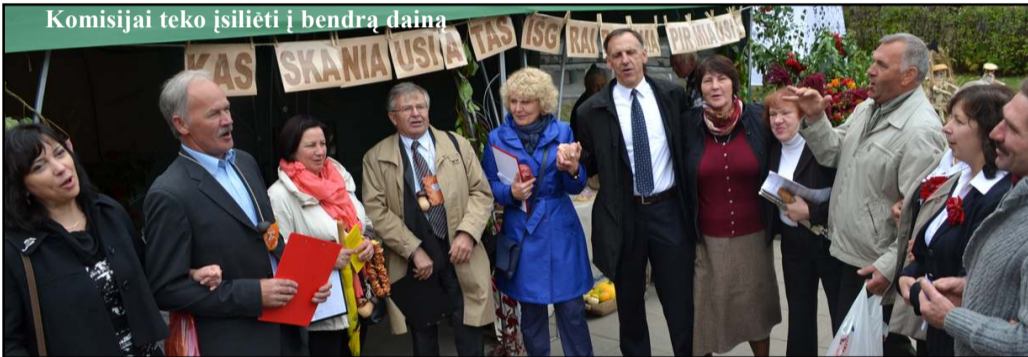
Komisijai teko įsilieti į bendrą dainą

šiuo kartu vertinti turėjo gėdintis prijuostę, išrinkti spalvingiausią eiseną ir išradingiausią kiemelį. "Mums buvo sunkiau vertinti negu jums pasirengti šventei," - atviravo komisijai pirmininkavęs meras, paskelbęs ne tik nominacijų nugalėtojus, bet ir pamintė, kam komisija skyrė antrą ir trečią vietas. Dėkavonė už spalvingiausią eiseną šiuo kartu atiteko Alantos seniūnijai, kuri aplenkė Luokesos ir Dubingių seniūnijų eisenas. Išradingiausiu kiemeliu paskelbtas Joniško kiemelis, bet komisijai patiko ir pas mindūniškus bei balninkiečius. O išpūdingiausią gospadinę prijuostę šventėje pristatė videniškėčiai, komisija dar išskyrė luokesiškių ir inturkiškių prijuostes. Išdalinus dėkavones ir