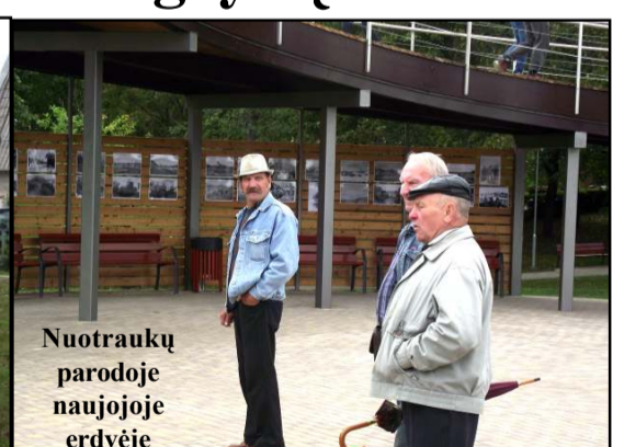
Nuotraukų parodoje naujoje erdvėje