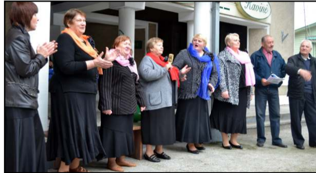
Komisijos visuose kiemeliuose buvo laukiama su daina