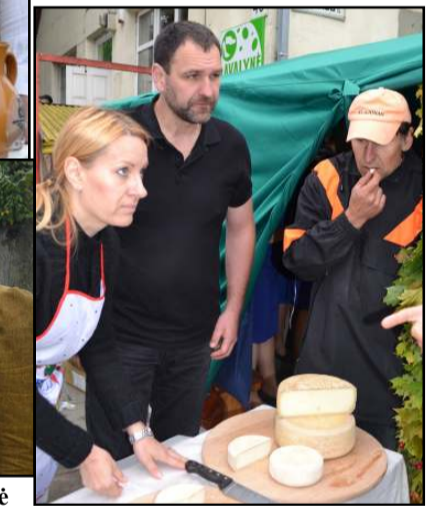
Inturkiškio G. Prakapavičiaus ūkio ožkų sūriai - gurmanams!