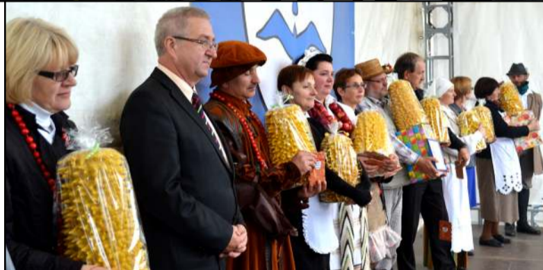
Visi vienuolika seniūnų buvo apdovanoti didžiuliais šakočiais

visi vienuolika seniūnų buvo apdovanoti didžiuliais šakočiais padėkojus visiems, kurie kuria Molėtų krašto kultūrą, gospadinės Indrė ir Laisvė iki kitų metų mugės su visais atsiveikino donelaitiškai -