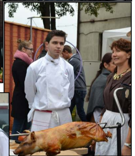
To dar nebuvo - mugėje visų akių vaizdoje kepamas paršiukas!

visi vienuolika seniūnų buvo apdovanoti didžiuliais šakočiais padėkojus visiems, kurie kuria Molėtų krašto kultūrą, gospadinės Indrė ir Laisvė iki kitų metų mugės su visais atsiveikino donelaitiškai -