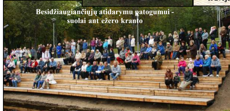
Besidžiaugiančiųjų atidarymu patogumui - suolai ant ežero kranto

atsirado unikali vieta ateiti, pabūti, pailsėti... Šeštadienio popietės sambūris šioje unikaloje vietoje šiuo kartą buvo skirtas Europos paveldo dienų ciklui, dviems jaunų ir perspektyvių skulptorių skulptūroms bei paties parko atidarymui. Simbolinę naujosios miesto skulptūrų, poilsio ir