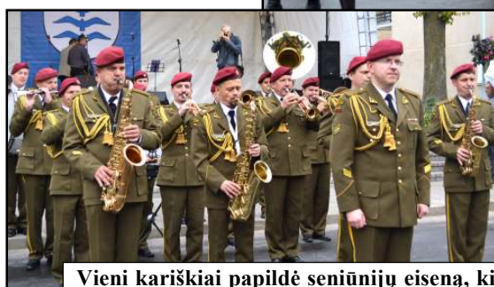
Vieni kariškiai papildė seniūnijų eiseną, kiti pramogas siulė...

siuvinėtos, joniškėčiai ją iš žolynų nupynė, o mindū- niškėčiai pribloškė į prijuos- tę nebetilpusia milžiniška žuvimi. Giedraitiškiečiai obuolių pažerė, inturkiš- kiečiai visą šių metų derlių prijuostėje buvo sukrovę, o videniškėčiai Baltadvario pilies baltumu spindinčią pačią didžiausią prijuostę į šventę atgabeno. Pati ti- tuluočiausia buvo Dubin- gių seniūnijos eiseną, ku-