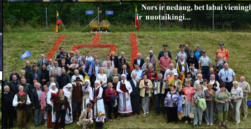
Nors ir nedaug, bet labai vieningi ir nuotaikingi...