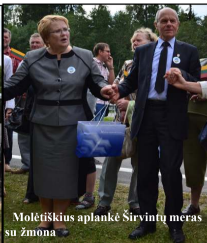
Molėtiškius aplankė Širvintų meras su žmona