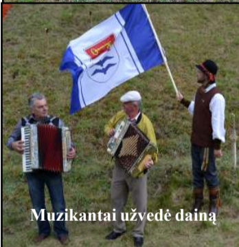
Muzikantai užvedė dainą