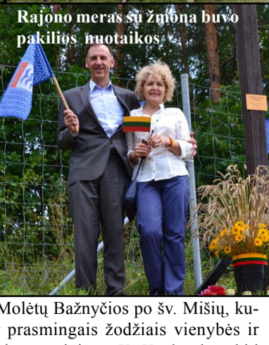
Rajono meras su žmona buvo pakiliš nuotaikos