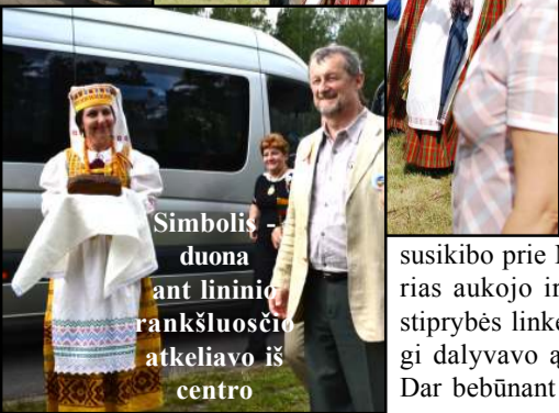
Simboliškos duonos ant lininio rankšluosčio atkeliavo iš centro