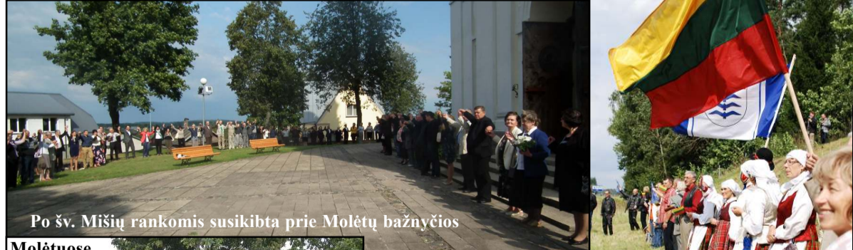
Po šv. Mišių rankomis susikibta prie Molėtų bažnyčios