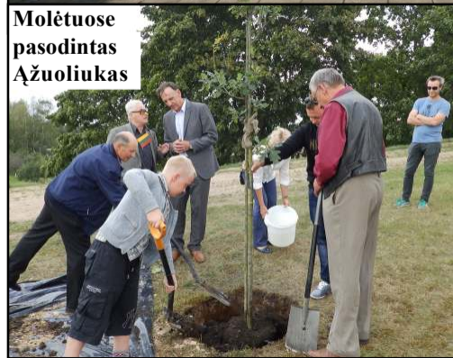
Molėtuose pasodintas Ažuoliukas