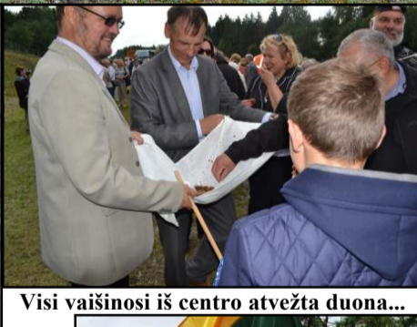
Visi vaišinosi iš centro atvežta duona...