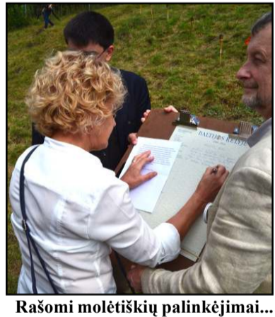
Rašomi molėtiškių palinkėjimai...