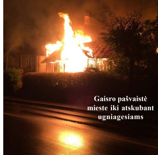
Gaisro pašvaistė mieste iki atskubant ugniagesiams

vė, matyt, iš susijaudinimo netiksliai informaciją, nes ugniagesiai buvo pasiūsti ne prie Vilniaus g. 64 namo, bet į jos pradžia... (Nr. 14)