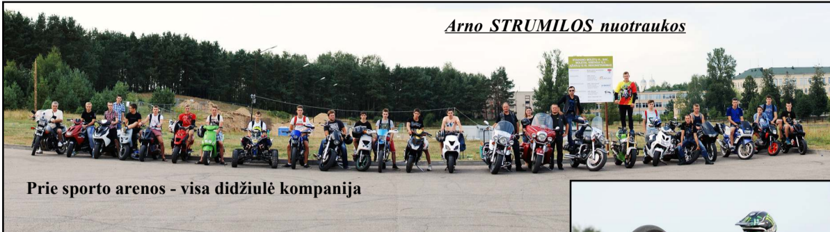
Prie sporto arenos - visa didžiulė kompanija

Graži gaudžianti ir įvairiaspalvė kolona vėl molėtiškiams priminė, kad čia esama baikerių klubo "Molmoto". Darniai išsirikiavus grėsmingai gaudžiančių senųjų baikerių mo-